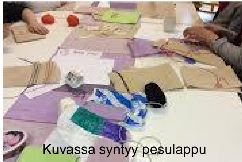
Kuvassa syntyy pesulappu

Toteutuksessa otetaan huomioon kerholaisen ikä- ja kehitystaso, Käyttäen erilaisia oppimismenetelmiä ja elämyksiä, esimerkissä teimme karjalankäkösen pesulappuun.