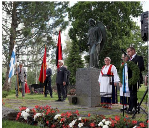
Kunniakäynnit Karjalaan jääneiden vainajien ja sankarihautausmaan muistomerkeillä.