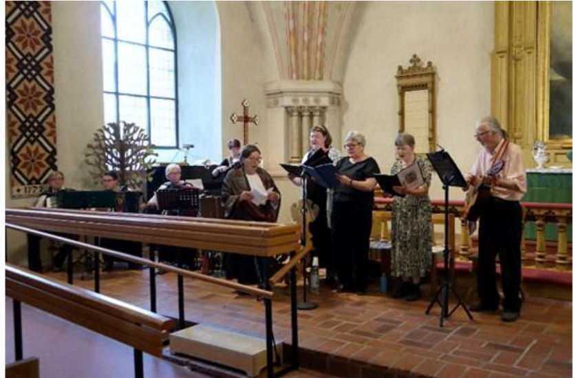
Kiikoisten pelimannipiirin musikot osallistuivat Karjalaisen kansan messuun.