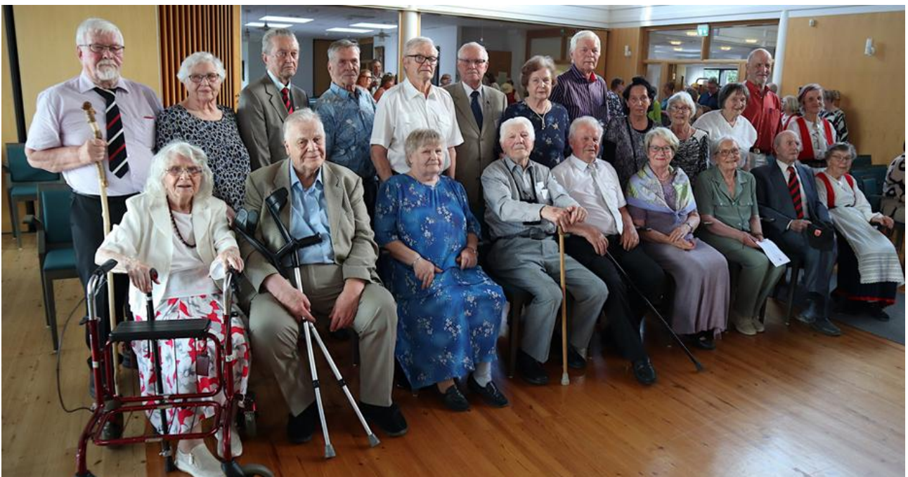
Vpl. Pyhäjärven juhlapyhän Pyhäjärvellä syntyneitä juhlavieraita.