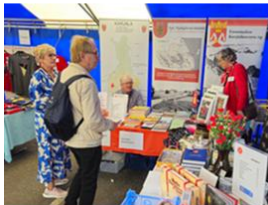
Vanhan kirjallisuuden päivillä Sastamalassa Vexve-areenalla säätiöllä ja Vammalan Karjalaseuralla oli yhteinen esittelypiste.