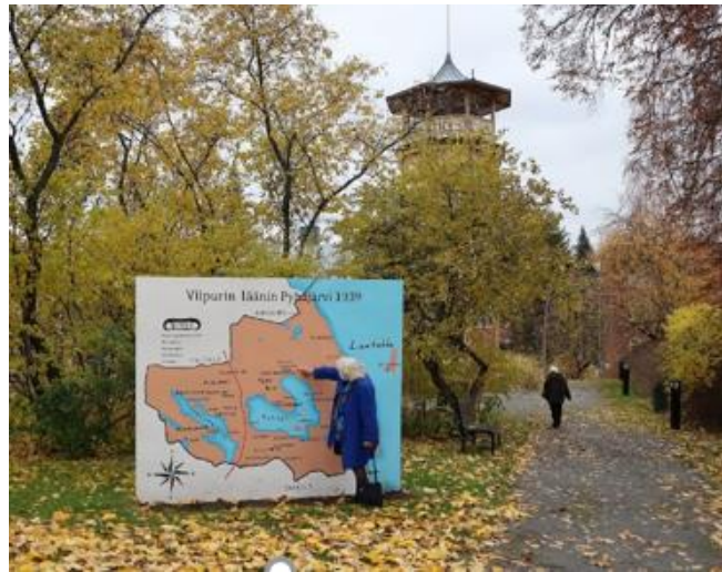
Viipurin läänin Pyhäjärven tyylitelty kartta Sastamalan seudun museon Tornihuvilan edessä.

Sastamalan seudun museon tornihuvilaan kootun näyttelyn nimeksi valittiin ”Siun ja miun – Viipurin läänin Pyhäjärvi”. Näyttelyn avajaiset olivat 2.10.2020 ja näyttely on auki 31.8.2021 asti. Näyttelyn tavoitteena on johdattaa näyttelyvieras matkalle pyhäjärveläisten elämään, evakkotaipaleelle sekä elävään karjalaiseen kulttuuriin. Näyttely perustuu Sastamalan seudun museon vuodesta 1959 lähtien karttuneeseen Pyhäjärvi-kokoelmaan, jota on täydennetty tekstitauluilla, valokuvilla ja joillakin yksityishenkilöiltä lainatuilla esineillä. Vanhin näyttelyssä esillä oleva esine on Vpl. Pyhäjärven ns. pieni kirkonkello, joka on valettu Tukholmassa vuonna 1634.