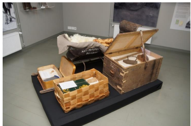
Näyttelyesineitä evakkoajasta kertovassa huoneessa.