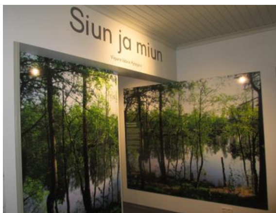
Näyttelyyn kävellään sisään keväistä vihreyttä hehkuvien pyhäjärveläismaisemien läpi.

Museo järjesti syksyn 2020 aikana Vpl. Pyhäjärvi-kokoelman ja näyttelyn tiimoilta joitakin yleisötilaisuuksia, joihin osallistui myös säätiön edustajia, jotka kertoivat näyttelystä ja Vpl. Pyhäjärvestä. Museon kaupassa on näyttelyn ajan myynnissä valikoima säätiön myyntituotteita.