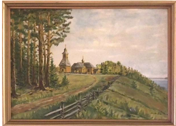
Heikki Karttusen maalaama Vpl. Pyhäjärven kirkkoa esittävä maalaus, jonka Riitta Kimari lahjoitti Vpl. Pyhäjärvi-Säätiölle.