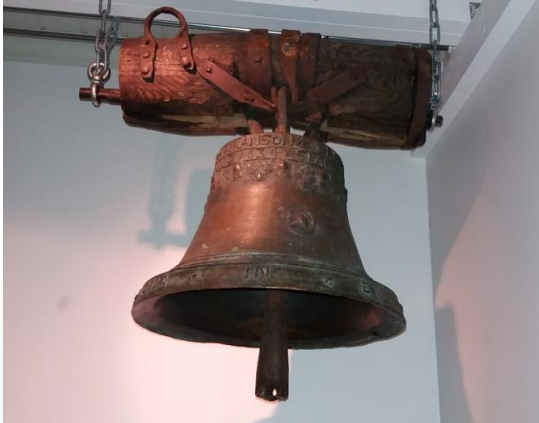
Vpl. Pyhäjärven ns. pieni kirkonkello 1600-luvulta kuuluu vanhimpiin luovutetusta Karjalasta säilyneisiin kirkonkelloihin.

viljelyksiltä Sortanlahden kauppapaikkaan -kirja, Vpl. Pyhäkylä-Seuran julkaisema Taubilan kartano – lahjoitusmaakaudesta Fazerin aikaan –kirja, Vpl. Pyhäjärvi-seura ry:n julkaisema Kuudes vuosikymmen karjalaista järjestötoimintaa pääkaupunkiseudulla 2007-2017 –kirja, Hilja Matikaisen runoja sisältävä kirja Matkan varrelta, Markku Heikkilän kirjoittama kirja Laatokan kevät, Pärssisten sukukirjat Mitäs myö Pärssiset I - II sekä säätiön kustantama DVD kesän 2017 Vpl. Pyhäjärvi-juhlista.