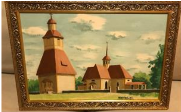
Vpl. Pyhäjärven kirkko ja kellotapuli säätiön saamassa lahjoitustaulussa. Kirkkoa ympäröivän aidan portti kirkon edessä.