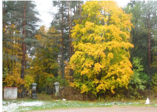
Sama portti syksyllä 2019 ensilumen aikaan.