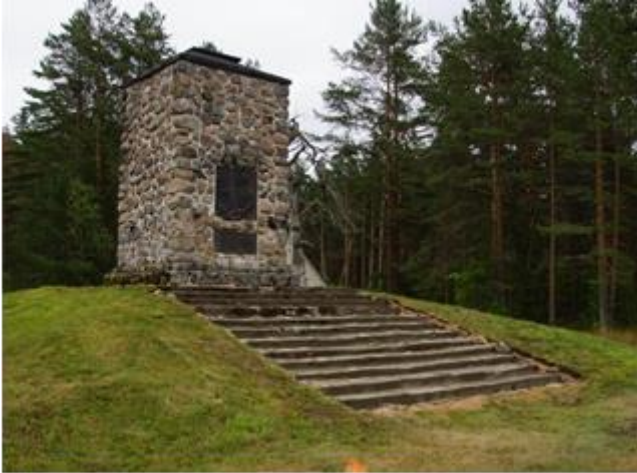
Lahjoitusmaatalonpoikien portaat kunnostettuna.