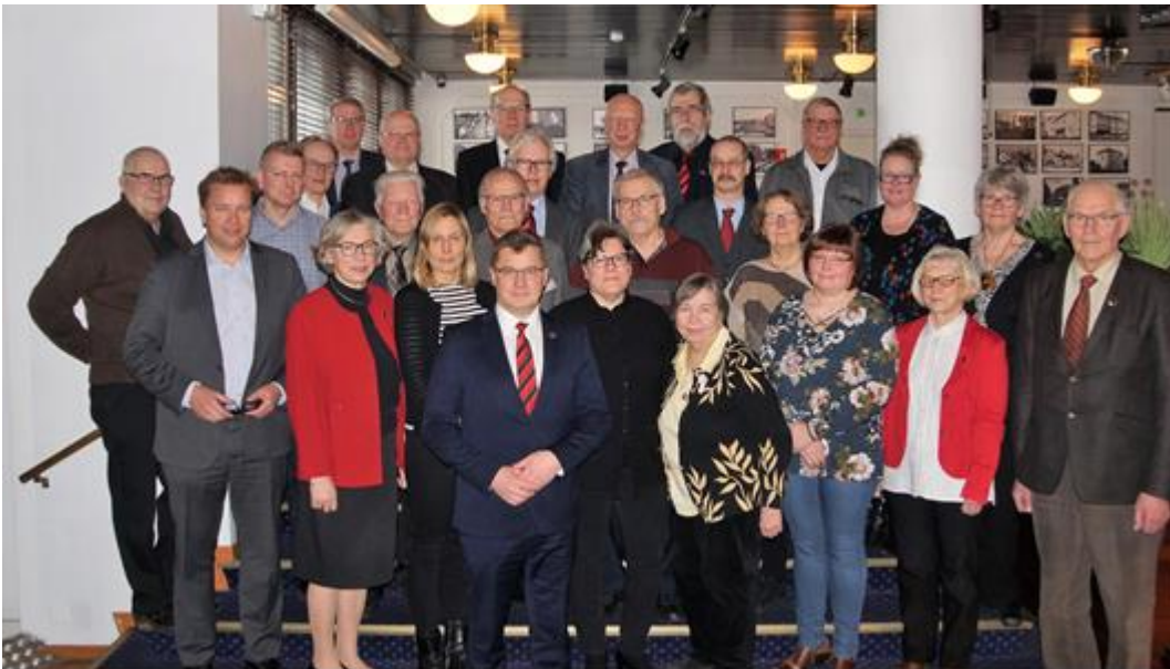
Hallintoneuvoston kokouksen osanottajat 17.3.2019.