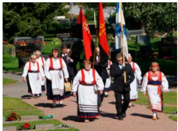
Lippulinna ja seppelpartio siirtymässä Huittisten sankari-vainajien muistomerkille.