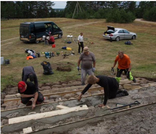
Työn touhua kirkkoaholla.

Alavuden kirkon vieressä on säätiön toimesta vuonna 1991 pystytetty Alavudelle evakkoaikana haudattujen 141 pyhäjärveläisen muistopaasi. Se puhdistettiin kaksi vuotta sitten Suomi 100-juhlavuoden merkeissä. Kivessä mustalla olevat tekstit erottuivat kuitenkin huonosti erityisesti kostealla ja sateisella säällä. Viime kesänä kivi kunnostettiin ja tekstit hopeoitiin. Nyt tekstit ovat selvästi luettavissa. Muistopaasi sijaitsee Karjalaan jääneiden vainajien muistomerkin läheisyydessä.