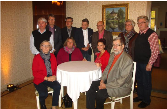
Suvannon seudun pitäjäjyhteisöjen kokouksen osanottajat Mikkelissä.