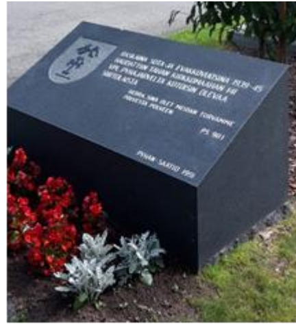
Alavuden kirkolla oleva muistopaasi