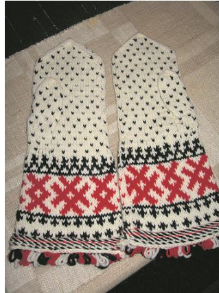
Tammikuun Vpl. Pyhäjärvi-lehdessä esiteltiin värikkäät Kiimajärven kintaat.