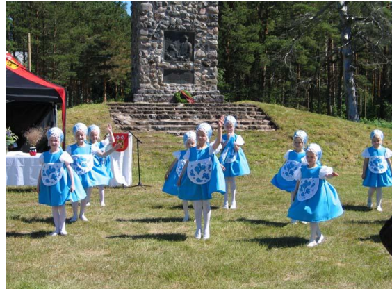
Ihastuttava lapsiryhmä Plodovojesta esiintymässä juhlilla.