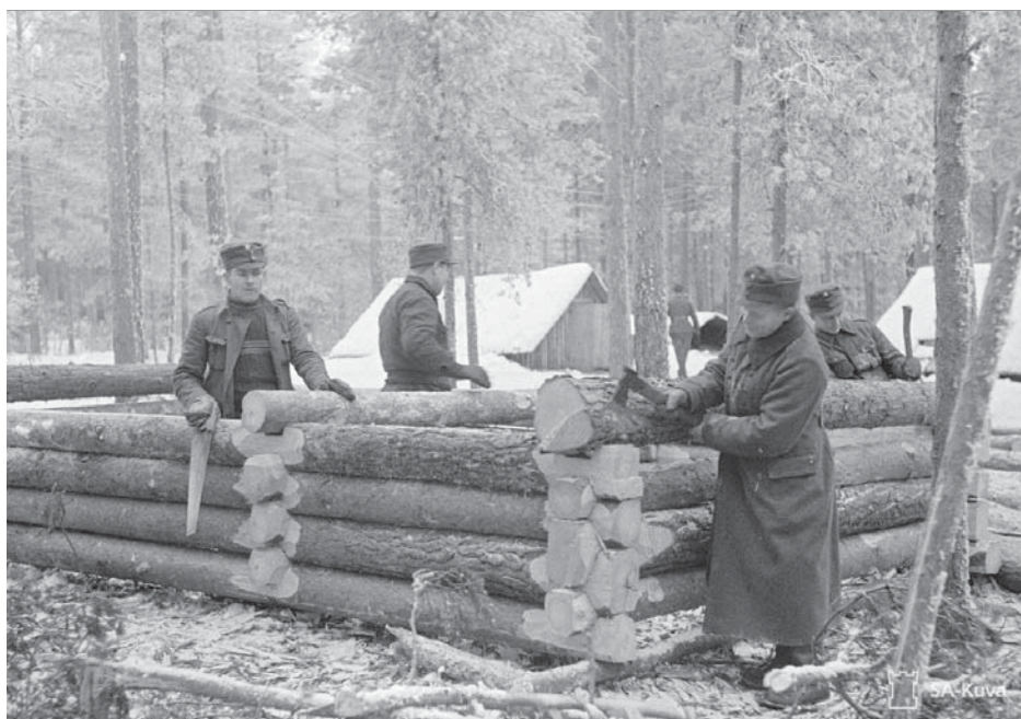
Korsua rakennetaan Pyhäjärvellä 12.17.1939 talvisodan alettua.