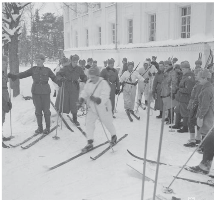
Konevitsan linnakkeen pojille on järjestetty 10 km ampumahiihto. Pojat lähtevät taipaleelle minuutin väliajoin. Konevitsa 14.2.1942.