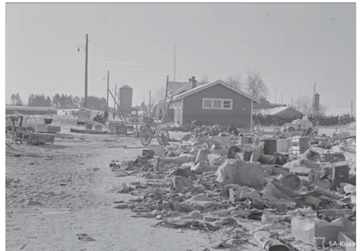
Evakuoituja tavaroita Pyhäjärven asemalla. 16.3.1940.