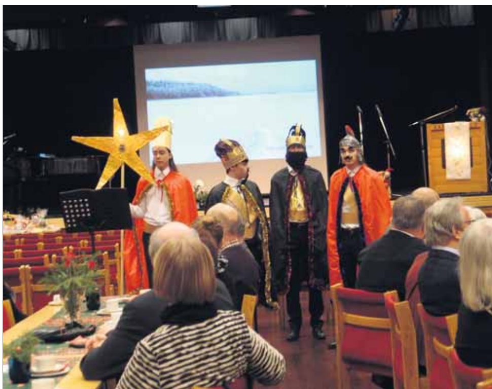
Tiernapojat, Helsingin luonnontieteen lukion pojat.