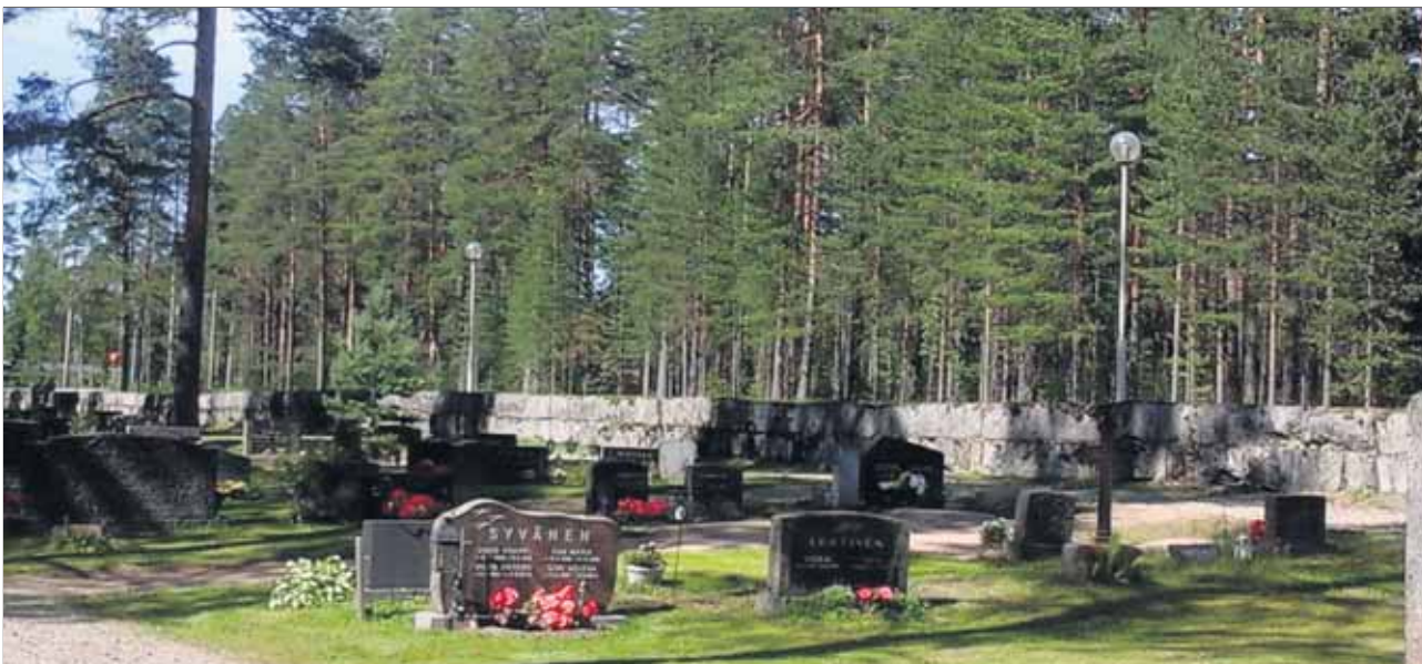
Keuruun uutta hautausmaata, jonka kuvassa näkyvän kiviaidan läheisyydessä on sijainnut Siirtoväen hautojen alue. Se on nyttemmin haudattu kokonaan uudelleen. Alue on hautausmaan nykyisen siunauskappelin läheisyydessä. SIVU 5.