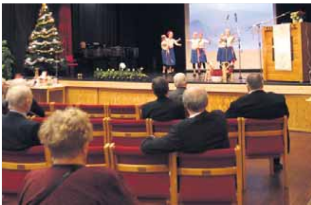
lan ja mikä tärkeintä: tavata tuttuja sekä tutustua uusiin karjalaisiin ihmisiin.