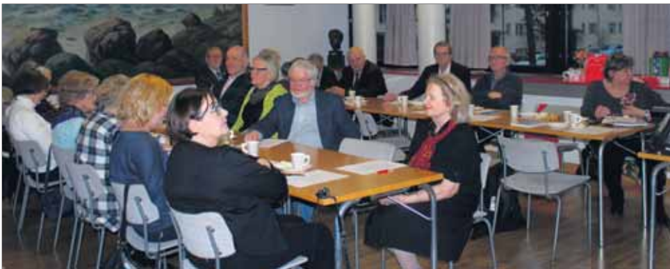
Syyskokoukseen osallistujia Sortava-salissa.