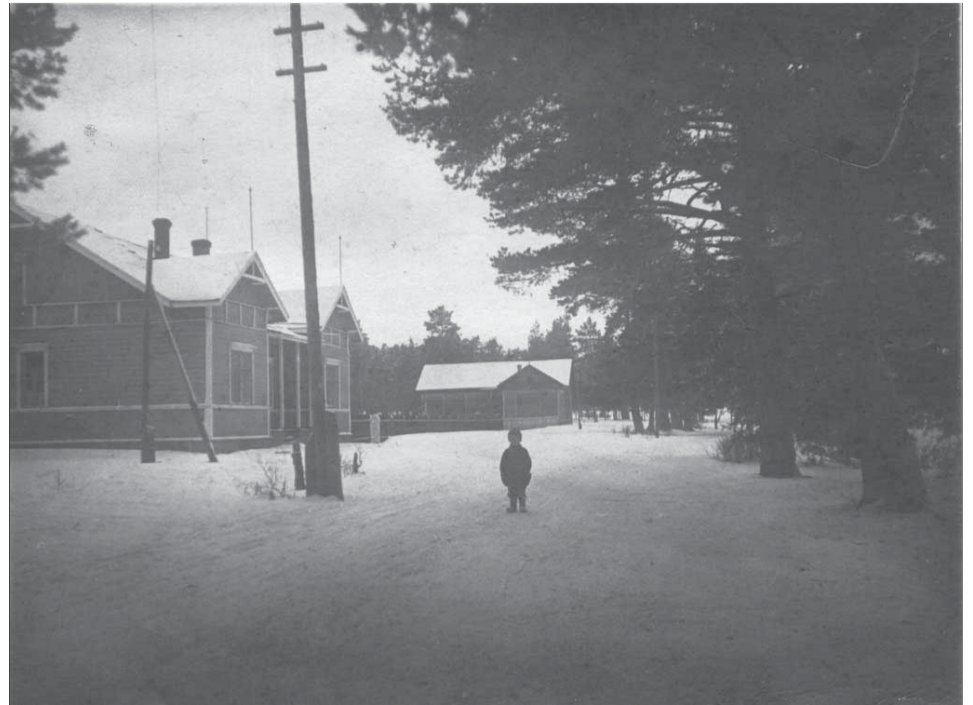
Kuvassa jossa pieni poika seisoo, taustalla oleva rakennus on ilmeisesti Etappi.