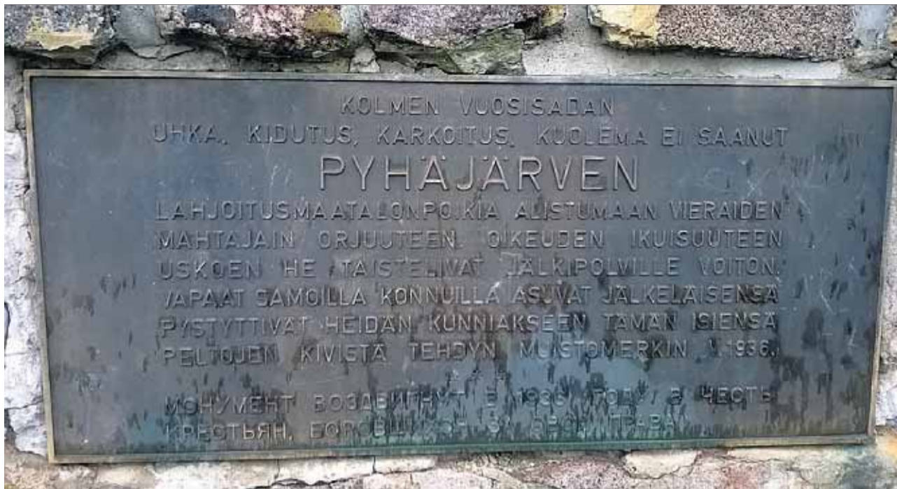
Lahjoitusmaatalonpoikien entisöity muistomerkki Pyhäjärvellä, syysateen aikaan 2016.

tämistä asiallisilla syillä vaatimaan. Ja tuskinpahan silvottu Suomi, itärajanaan Kymi ja Saimaa, olisi jaksanut milloinkaan itsenäistyä.