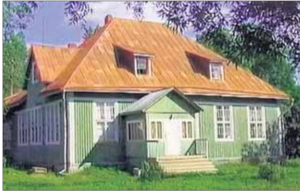
Musakanlahden kansakoulu 1998.