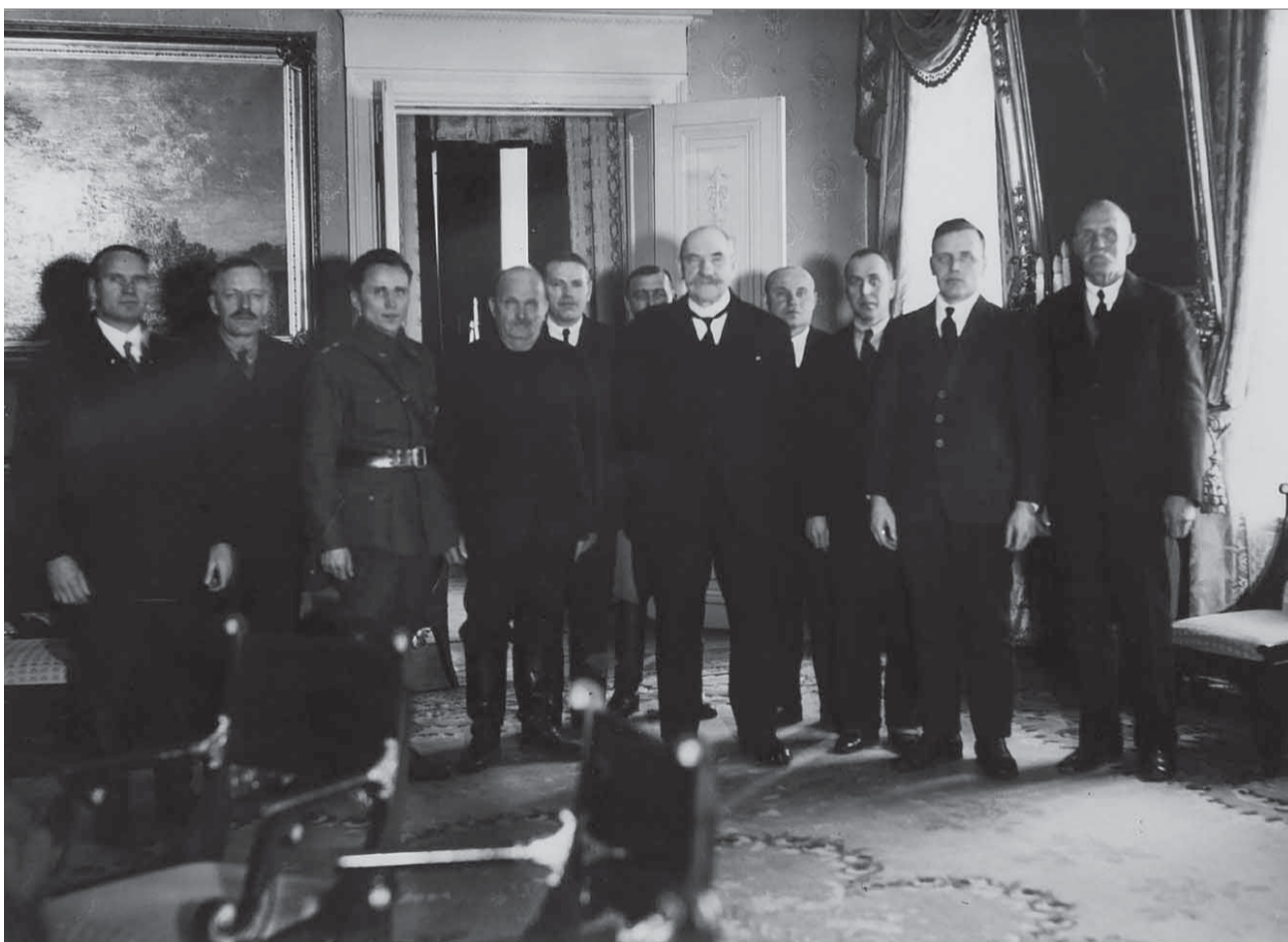
Lahjoitusmaatalonpoikien lähetystö presidentti Svinhufvudin luona 1930-luvulla.

Oheinen valokuva on ollut aikanaan Keuruulla mummolani seinällä niin kauan kuin muistan. Olen tiennyt, että lähetystön käynnin syynä presidentti Svinhufvudin luona oli lahjoitusmaatalonpoikakysymys.