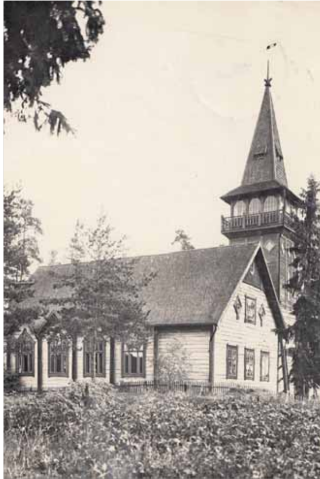
Siuron rukoushuone vanhassa postikortissa. Rakennus valmistui 1910. Kirkoksi se vihittiin 1938 ja siirtyi Nokian seurakunnalle 1956. Siuron kirkko on sen lähialueella asuville pyhäjärveläisille tullut tutuksi rippikoulu - ja vihkikirkkona.