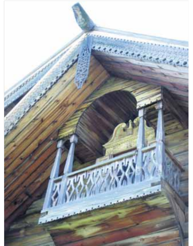
Kauniita yksityiskohtia Kizhin saarelle 1876 siirretyistä Oshevnevon talosta.

Pysähdyimme syntyperältään vepsäläisen Aleksanteri Syväriäläisen 1500-luvulla perustamalla kauniisti kunnostetulla Pyhän Kolminaisuuden luostarilla ja