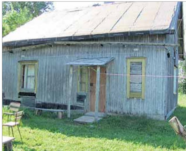
Hannun äidin kotitalo Pyhäjärven Lahnavalkamassa.