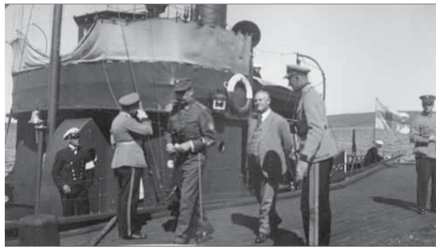
Mannerheim Kelpän maisemissa 1934.

Kelpän tykkiasemissa näkyy sekä 1920-luvun linnoitteita kauniine mutta vähän suojaavine sileine betonirakenteineen että vuonna 1939 rakennettuja ja jatkosodan aikana täydennettyjä linnoitteita. Osin räjäytetyt tykkiasemat, miehistösuoja ja ammusuojat ovat todella lujaa tekoa. Raskasta 1-palkkia ei ole säästetty. Tykkiasemat on