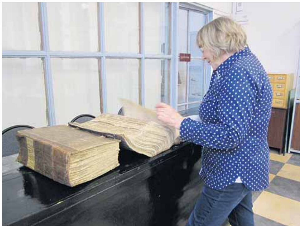
Arkistotutkija työssään vanhojen asiakirjojen äärellä.