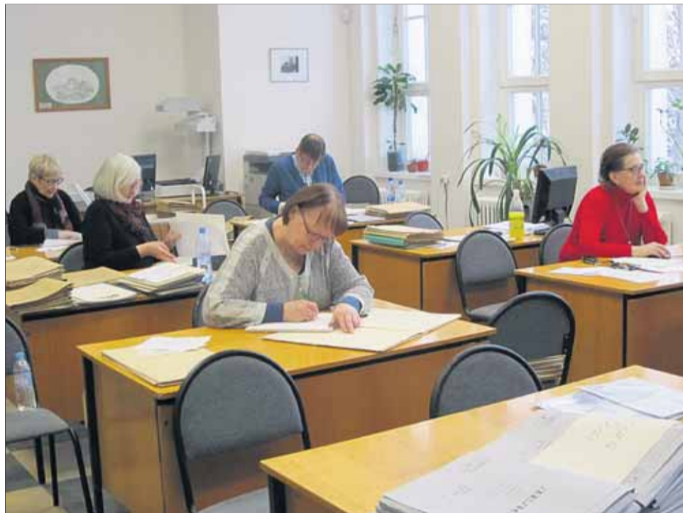
Näkymä Viipurin arkiston tutkijasalista. Sopiva ryhmä on 6-8 tutkijaa.