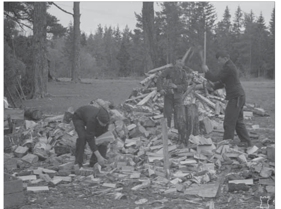
Saksalaisen KM-veneläivueen miehiä puunhakkuussa telttansa edustalla. Sortanlahti 20.10.1942.

Kirjoitus on aiemmin julkaistu Jaakkiman Sanomissa