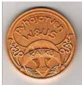
Kaiun muistoviestin mitaleita.

Ilmoittautua voi jo nyt (viimeistään 2.7.2017 mennessä): Reijo Paussu re.paussu@gmail.com tai puh. 0500 305 825 Vatakuja 1 A 4, 00200 Helsinki Nyt porukalla kisaamaan ja lystiä pitämään!