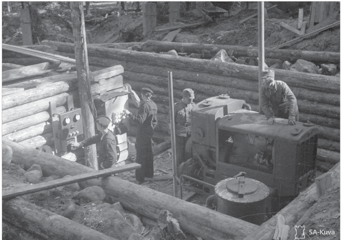
Sortanlahden suuren komentosuuren yhteyteen rakennetaan voimalaitoskorsu. Siihen on sijoitettu venäläinen puukaasutaja sekä samaa valmistetta oleva moottori ja generaattori. Sortanlahti 29.8.1942.

Vain rautoja rantakallioissa on jäljellä Mökerikön laiturista, johon vain pienet yhteyksalukset muinoin kiinnittivät. Laiturialueen kupeessa on taulu, jossa tuskin havaittava teksti