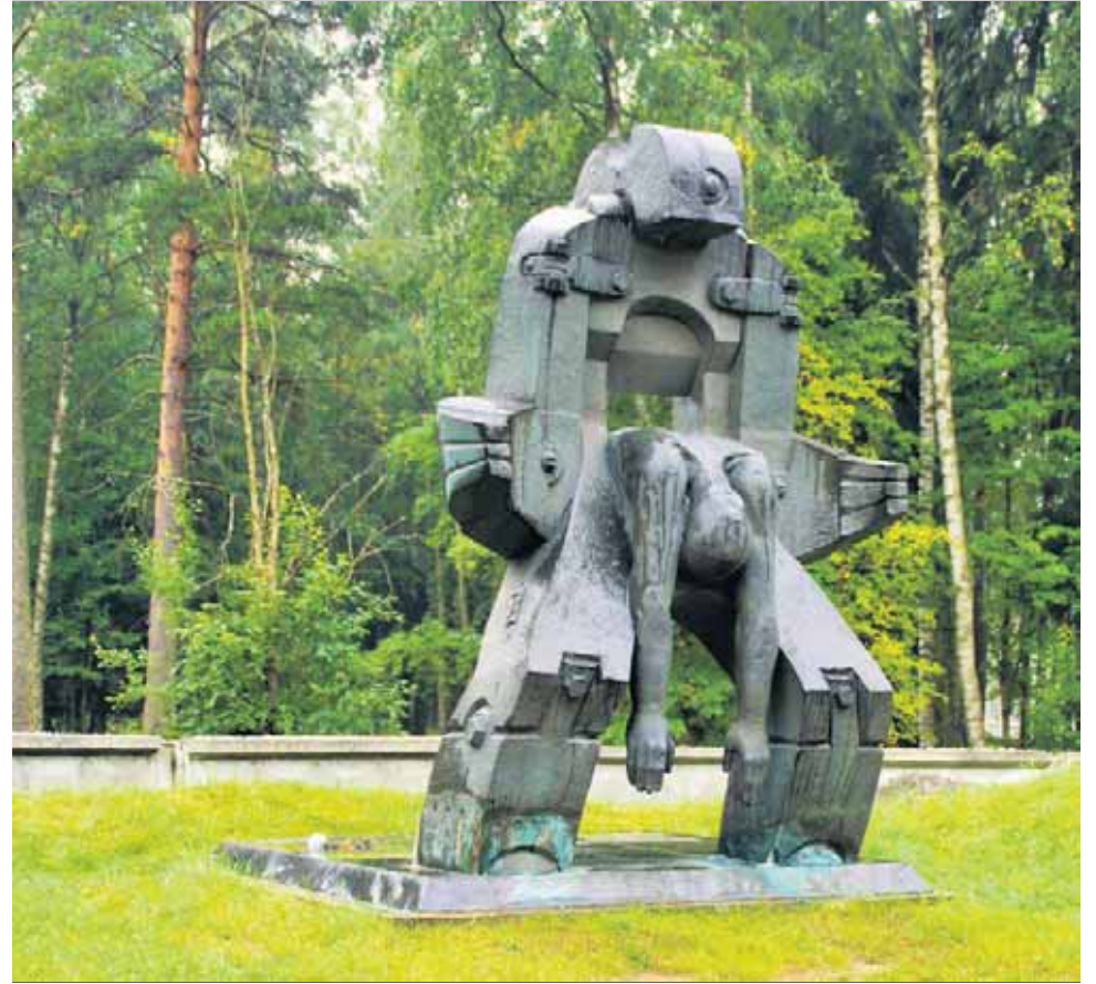
Muistomerkki Levassovassa.