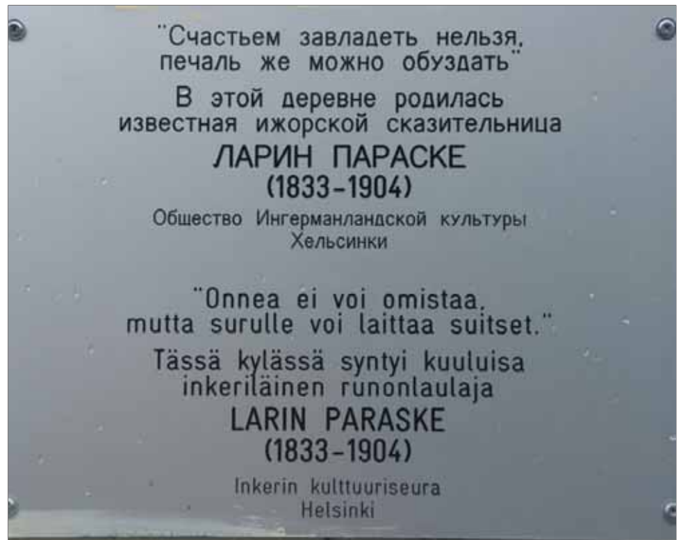
Laatta Mäkienkylän kaupan seinässä.