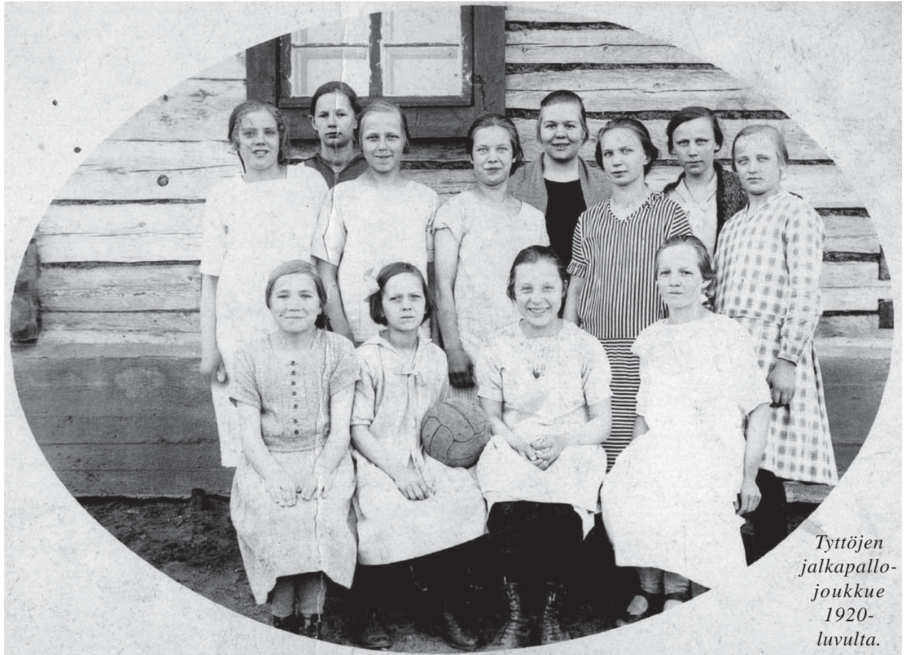
Tyttöjen jalkapallojoukkue 1920-luvulta.

Valitettavasti sai pyhäjärveläinen urheilu toimia omalla kotiseudullaan vain 24 vuotta, kunnes sodan seurauksena urheilijoiden oli pakko hajaan-tua ympäri maata. Kaiun muistokilpailuja on jatkettu täällä uusilla asuinsijoilla. On kamppailtu köydenvedossa paikkakunnan päättäjien ja pyhäjärveläistenvälillä, sekä Kaiun muistohiihdossa tai viestinjuoksussa. Viime heinäkuussa Sastamalassa Kaiun 100-vuotisjuhlaviestiin osallistui peräti kuusi joukkuetta.