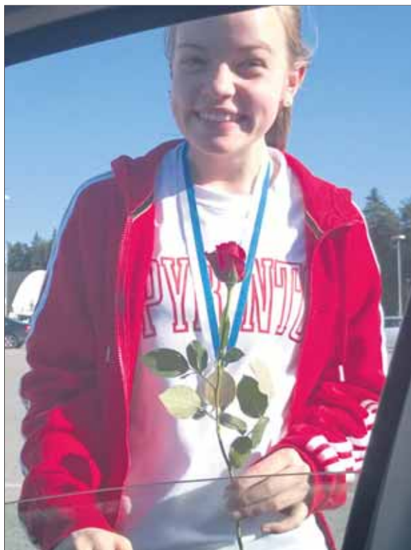
Kukitettu koripallon SM-kultamitalisti keväällä 2014.