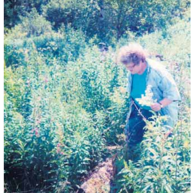
Elsa tati Saapun kodin kivijalalla.

Olit Laatokka suoja Kannaksen. Olit helmi kuin kaihoisa kyynel. Soi mainingit ulappas uhmaten ja aaltos kuin Väinölän kannel Rantahiekoilla punaruskean minä muinoin lapsena leikin ja sylissä aaltojesarmahan kesäpäiväni suloiset vietin. Vaan syksy saapui uhmaten ja nyt aaltosi myrskyten pauhaa. Ne huokaa surusta huomenen ja vaikeroi mennyttä rauhaa. Pitkän sodan, synkän ja urhoollisen, sinun puolestas taisteltiin, vaan uhriksi rauhan ja vapauden, sinut lunnaaksi riistettiin. Nyt siniaaltosi vankina soittaa surulaulua vapauden, kunnes untemme aamu koittaa tuon vapaan huomenen.