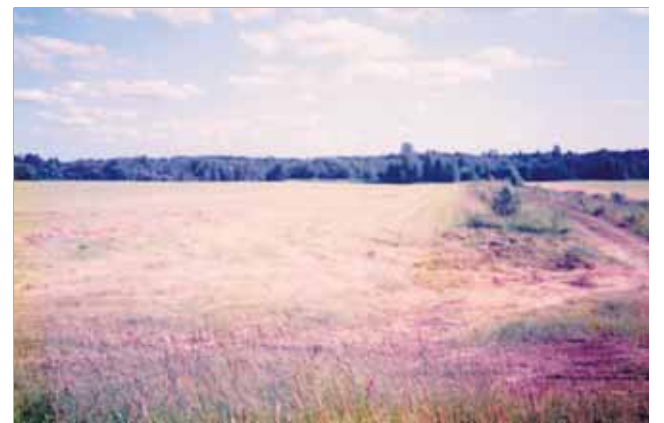
Rasilaisen paikka Saapurussa.