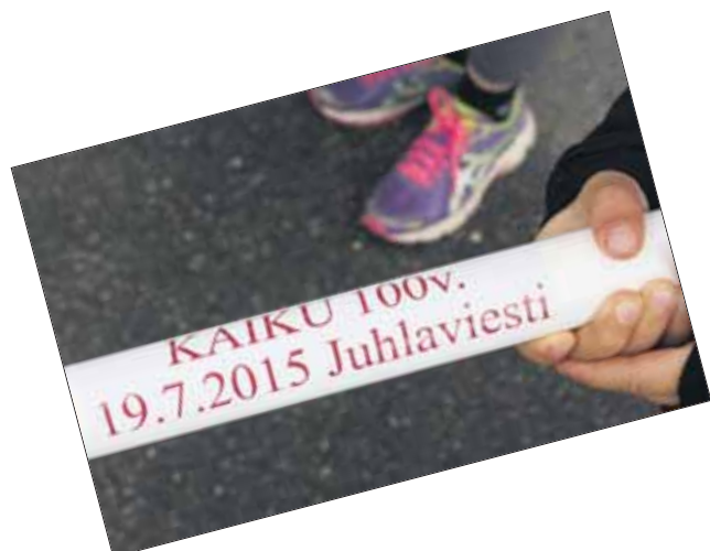
Juhlaviesti on juostu.

. Vpl. Pyhäjärvi-juhlat olivat 19.7. Esitämme sydämelliset kiitoksemme juhlatoimikunnalle, talkooväelle, ohjelmansuorittajille, yksityishenkilöille ja yhteisöille, sekä arvoisalle juhlayleisölle. Teidän kaikkien myötävaikutuksella saimme viettää monipuolisen juhlapäivän Sastamalassa. Tapaamisiin 70. juhlilla, paikasta ja ajankohdasta ilmoitetaan myöhemmin.