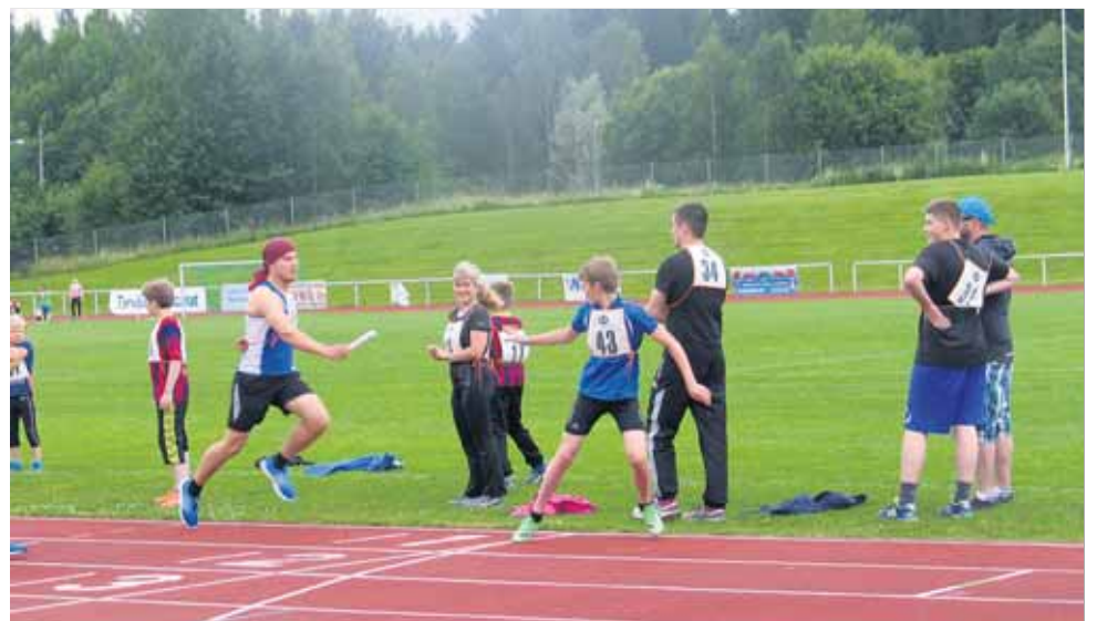
Voittajajoukkueen vauhdikas kapulanvaihto.