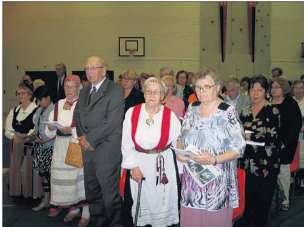
Juhlayleisöä ja Karjalaisten laulu.

makkaissa sanoissa on ollut mukana profetiaa. Ora et labora – ”rukoile ja tee työtä!”.