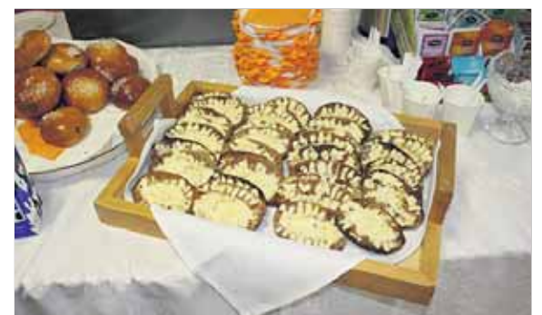
Kotitekoiset karjalanpiirakat kuuluvat ilman muuta juhlille.