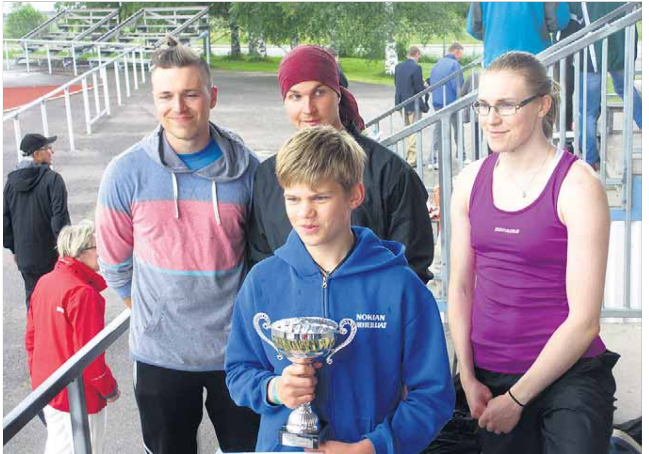
Voittajajoukkue pokaalinsa kera.