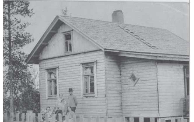
Sipponen kotitaloa Noitermaassa 1930-luvulla.