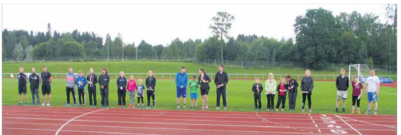
Joukkueet palkintojenjaossa.