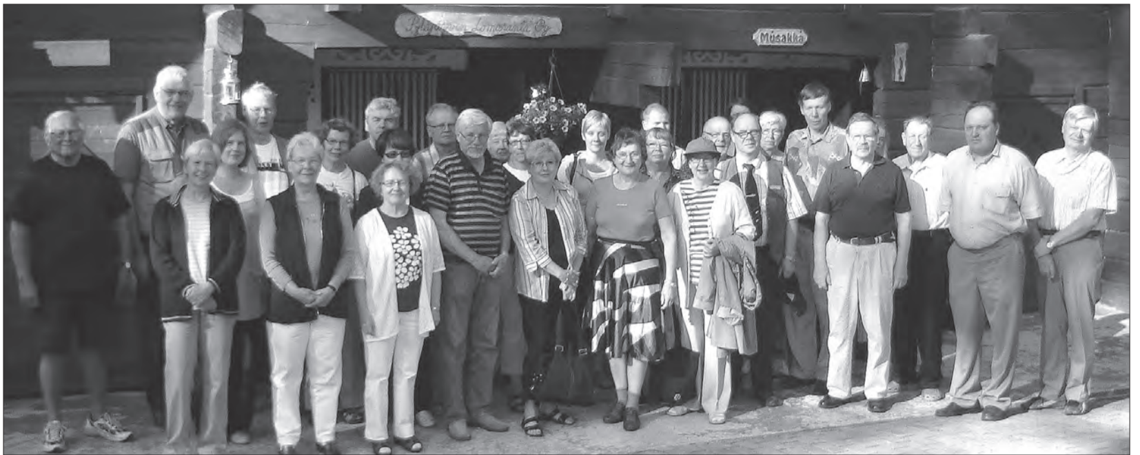
Matkalaiset yhteiskuvassa kotiinlähöpäivän aamuna Musakalla.