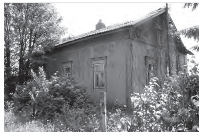
Kotini oli edelleen pystyssä Lahnavalkamassa.