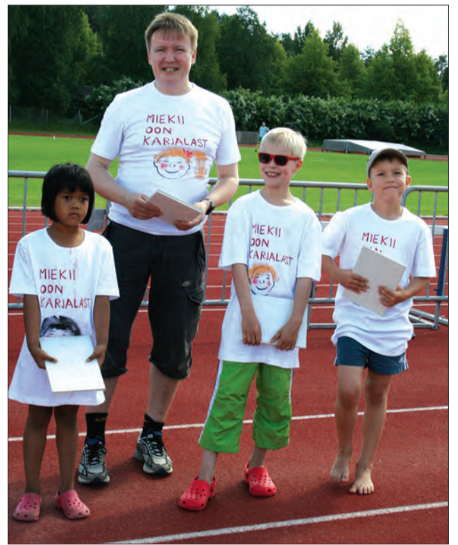
Sipposten joukkue hävisi viestijuoksun, mutta voitti parhaan asun palkinnon Miekii oon Karjalast-paidoissaan. Joukkueen kokoonpano on sivulla 16.