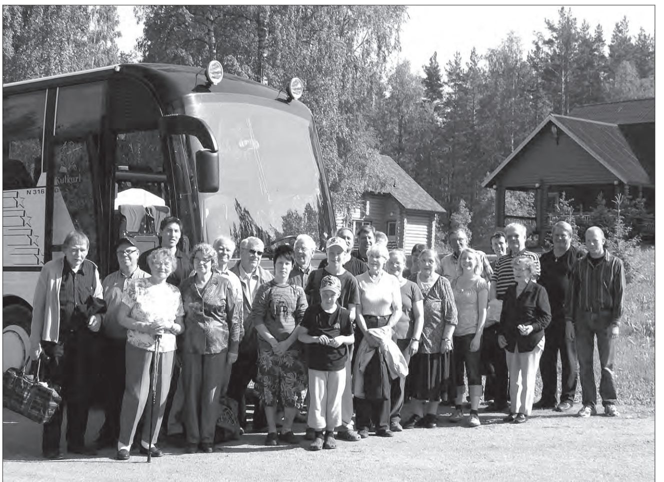
Kauvatsan Karjalaisten järjestämän kotiseutumatkan matkalaiset liikennöitsijä Hannu Putuksen seurassa. Matkan selostus viereisellä sivulla.