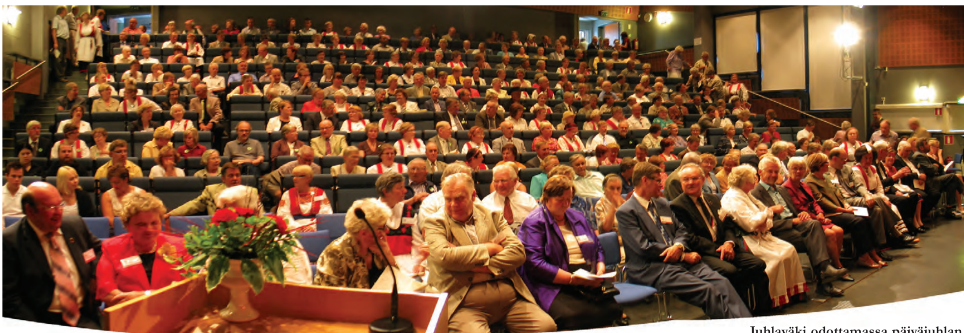
Juhlaväki odottamassa päiväjuhlan alkua.