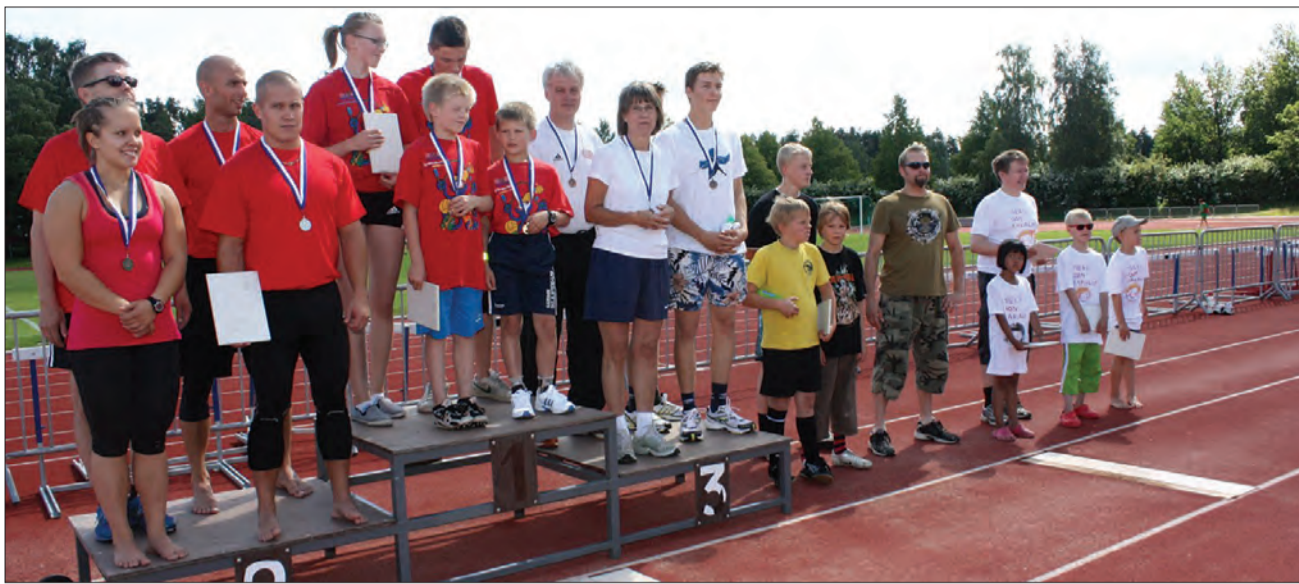
Muistoviestin osattajat palkintojenjaossa.