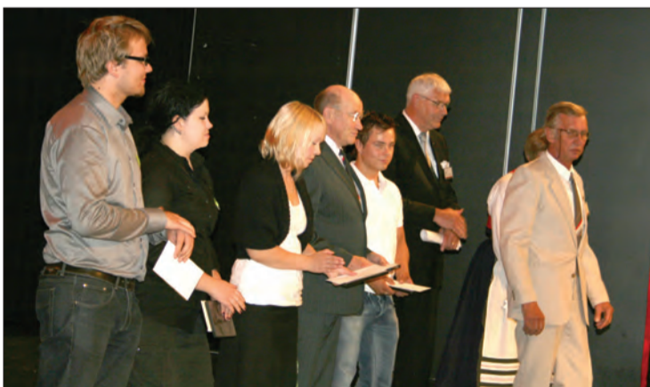
Nuorilla on suvi-aikaan kesätyö- ja matkustelukiirensä, mutta osa ehti kuitenkin itse hakemaan saamiaan stipendejä.