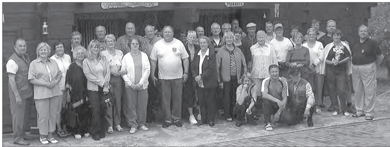
Kotiseutumatkot kokoavat vuodesta toiseen väkeä. Meidän ryhmämme yhteiskuvassa Musakalla.