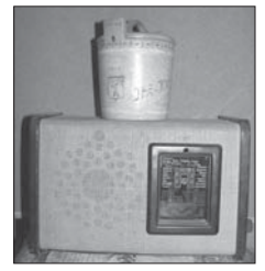
Radio ja puhdetyöt olivat esillä usein korsuissa varsinkin asematavaiheissa.