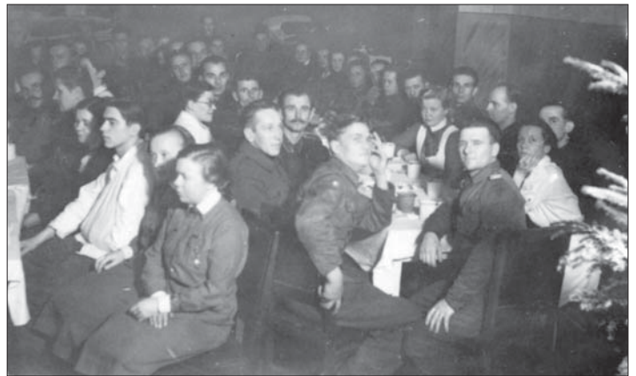
Syväriillä sijainneen kenttäsaaralan 32 väkeä joulunvietossa vuonna 1942.

Viipurin ja Valkjärven joulunajan radiolähetyskeskiksi lisäksi lähetettiin Karja-