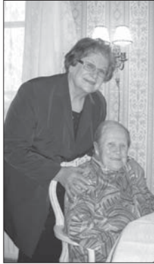
Kummityttö onnittelemassa päivänsankaria.

Suomi oli julistautunut itsenäiseksi vuotta aikaisemmin 6.12.1917. Sen jälkeen syntyi sisällissota, jota käytiin Pyhäjärvelläkin, vaikka tilanne Karjalassa ei ollut