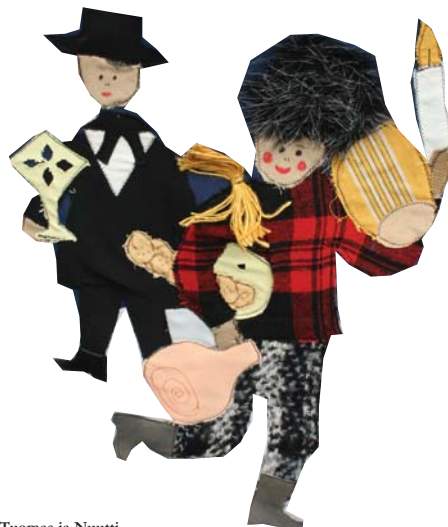
Tuomas ja Nuutti. Kuva Marjo Ristilä-Toikka, Soi!i Turkkisen kirjasta Joulupukin matkassa maailmalla.

Tuli teurastamisen aika. Verta otettiin harvoin talteen. Suolet pestiin pakka-sellakin ulkona. Sisälmysten ja syltitytarpeiden turvottaminen ja ruoaksi valmistaminen oli aikaa vievä työ. Sorkat korvennettiin saunan uunissa, saippua keitettiin saunan padassa. Padan pohjalle jäi mustaa mönjää, jolla pestiin lattia. Yhtenä päivänä paistettiin uunillinen leipiä, myös eläi-