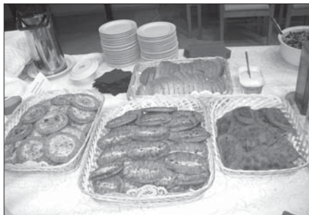
Piirakoiden leipomisen parissa saattaa vierähtää koko päivä.