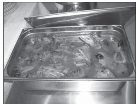
Perinteisessä karjalanpaistissa pitää olla tuhdit ainekset - ei mitään vetistä velliä.

– Tunnelma oli korkealla ja tuottona oli yli 1000 euroa seurakunnan nimikko-lähetin työn tukemiseen. Karjalaa ei ole saatu takaisin, mutta aito karjalanpaisti tuli, ja voimalla.