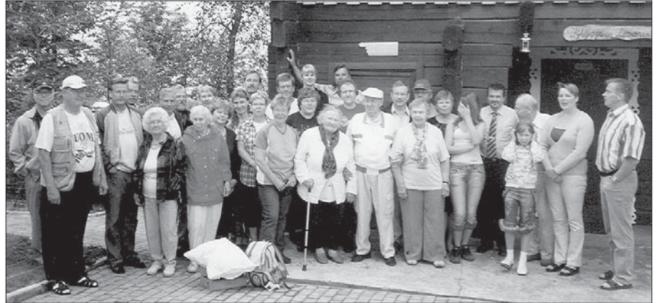
Matkalaisia Musakan lomarrannassa.