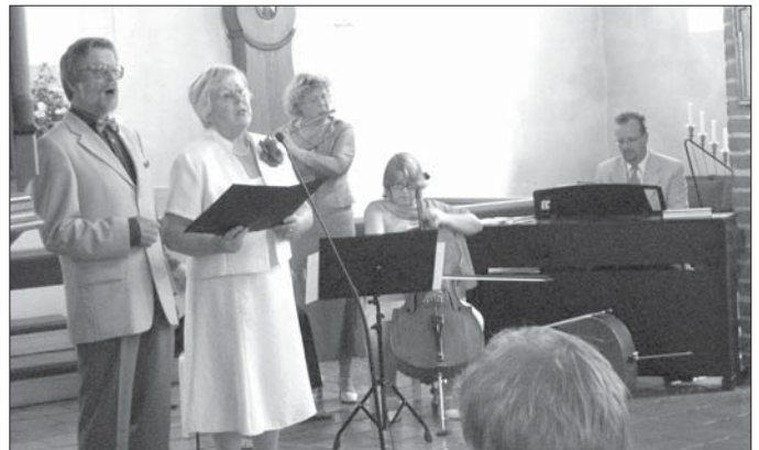
Juhlapari esiintymässä ”omatekoisen” orkesterin säestämänä.