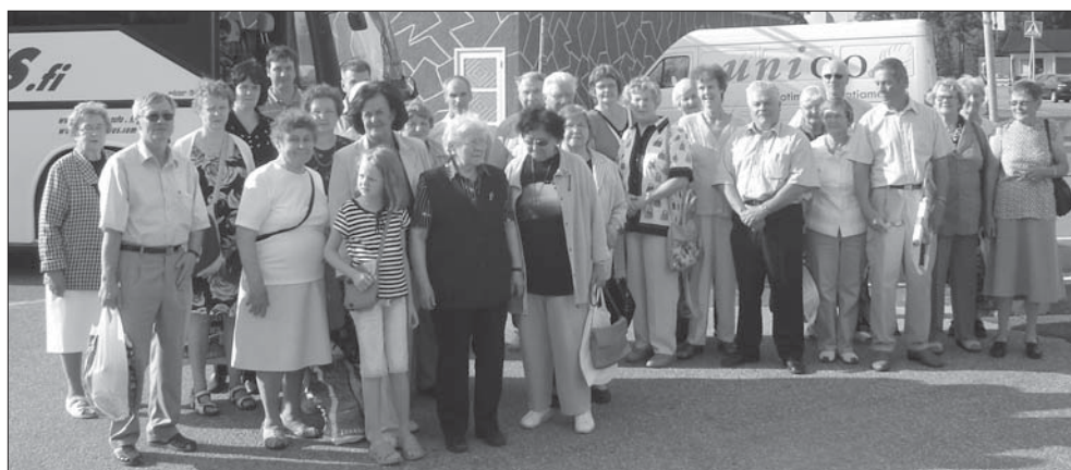
Jakokunnan väki kokoontui yhteispotrettiin ennen kotiin lähtöä.