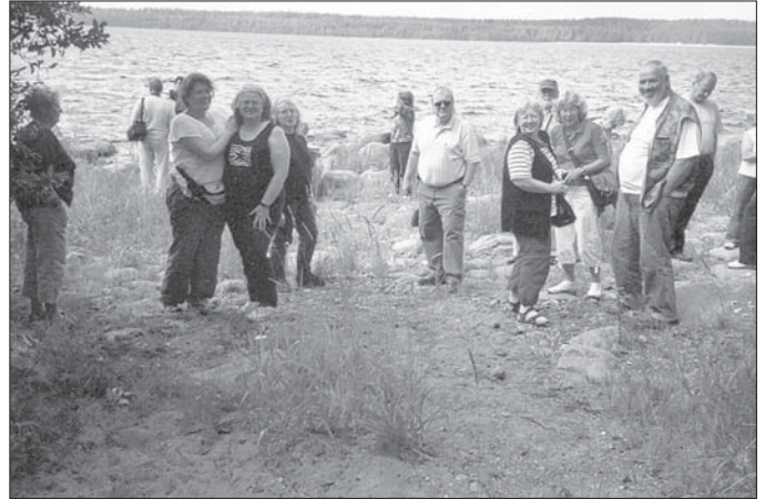
Matkalaisia Ylläppäessä 18.07.2007.