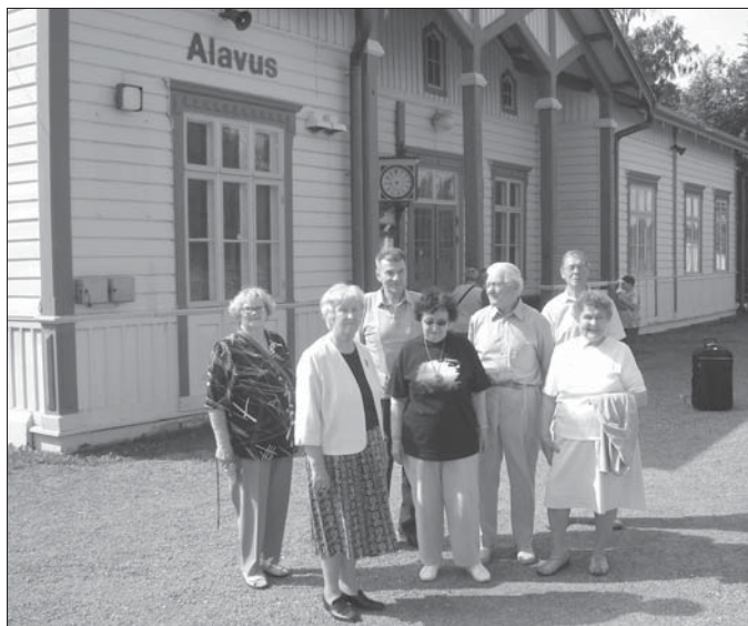
Joukko vanhempia matkalaisia halusi ryhmäkuvaan verestämään entisiä muistoja Alavuden asemalla.