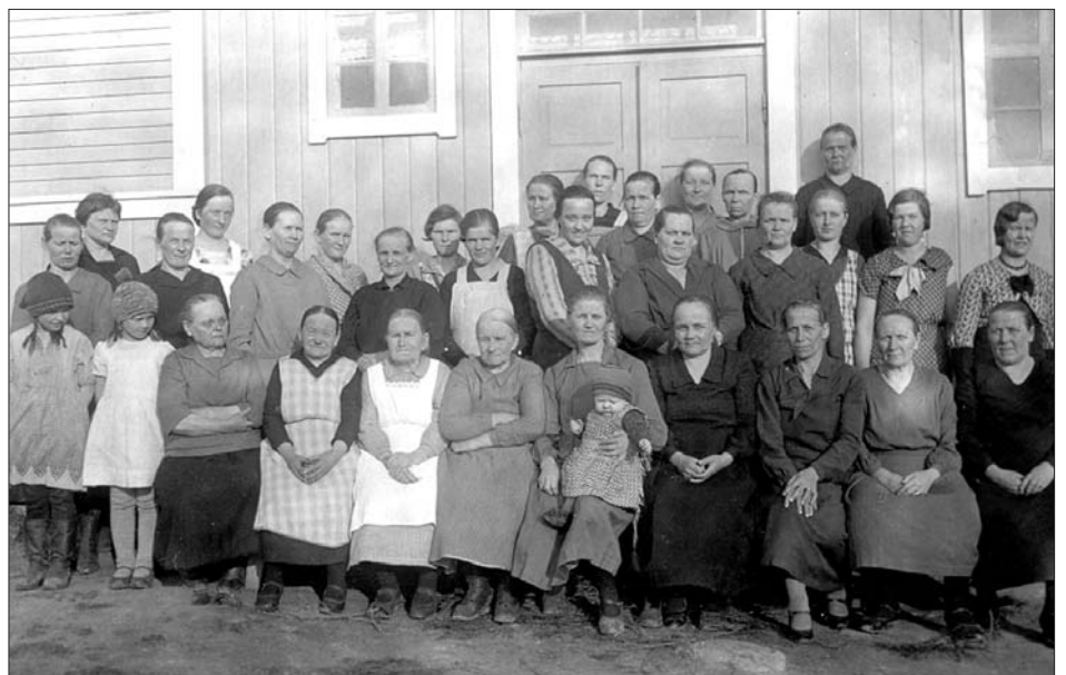
Keljan ja Rotjanlahden emännät kananhoitokurssin yhteiskuvassa 1930-luvulla.