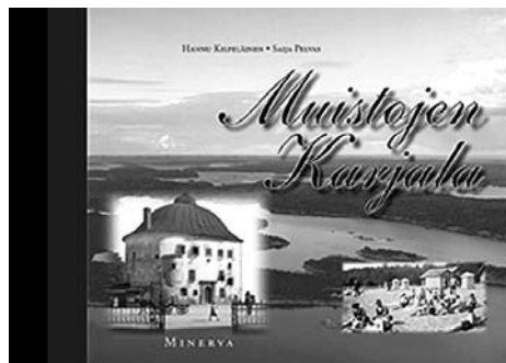
Muistojen Karjala on kolmas Vuoden karjalainen kirja.

Teoksessa luovutettua Karjalaa ei ole pilkottu pitäjiksi, vaan se tuodaan esiin osana kulttuurista kokonaisuutta, johon ovat vaikuttaneet niin luonnonolosuhteet kuin luontoa muokanneet ja ympäristöään rakentaneet karjalaiset. Karjalaiset ovat eläneet aina rajan kansana, joka on ottanut kulttuuriset vaikutteensa sekä lännestä että idästä. Kirjan teksti rakentuu Karjalan ja sen muistojen välittämiseen muisteluitten, kuvien ja niiden taustatietojen kautta. Karjala on enemmän kuin mitä