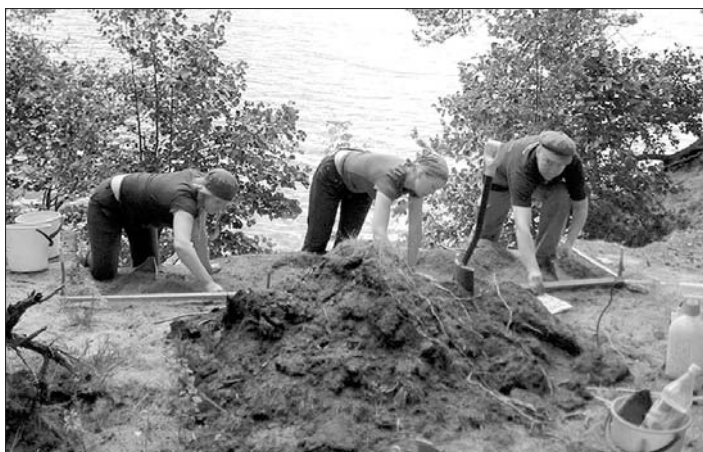
Kaivaus käynnissä Yläjärven rannalla Vanhasniemi 3:n asuinpaikalla.

Kesän 2006 tutkimuksiin osallistivat arkeologit Oula Seit-