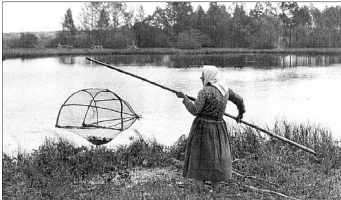
Kalastusta Kurosen lammella 1930-luvulla.