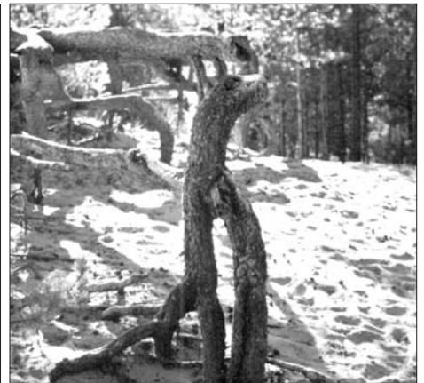
Laatokan rannassa Vuohensalossa olevaa mäntyä on kuvattu monissa yhteyksissä. Tämän kuvan on ottanut Risto Kukko (Hanko) syksyllä -06. Luontoihmisenä hän havaitsi saukon kotiutuneen männyn juurakoon.