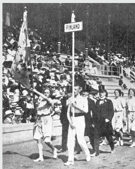
Suomen joukkue Tukholman olympialaisten avajaisissa 1912.

Ruotsalaiset isännät kuitenkin järjestivät suomalaiset marssimaan omana ryhmänään, jonka erotti edellä olevista venäläisistä heidän valmistamansa Finland-tekstin sisältävä nimikilpi. Avajais-