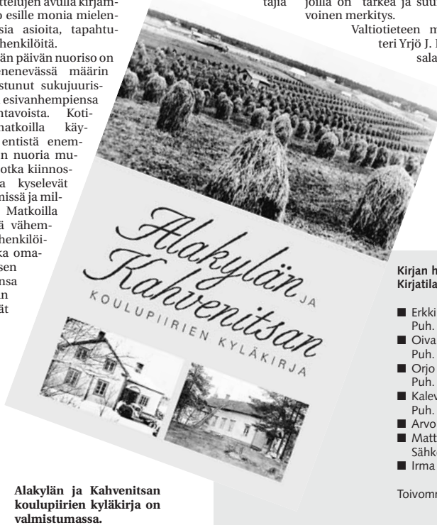
Alakylän ja Kahvenitsan koulupiirien kyläkirja on valmistumassa.

Kirja saadaan ulos kirjapainosta tulevan joulukuun alkuun mennessä, joten se ehtii jakeluun ja myyntiin joulumarkkinoille. Uskomme, että kirja palauttaa mielellään monia mielenkiintoisia asioita ja tapahtumia entiseltä kotiseudulta sen asukkaalle ja heidän jälkipolvilleen. Se on myös hyvä joululahja tai muu lahja nuoremalle sukupolvelle antoisalle kirjallisuudelle kotiseutumatkalle Alakylän ja Kahvenitsan koulupiireihin.