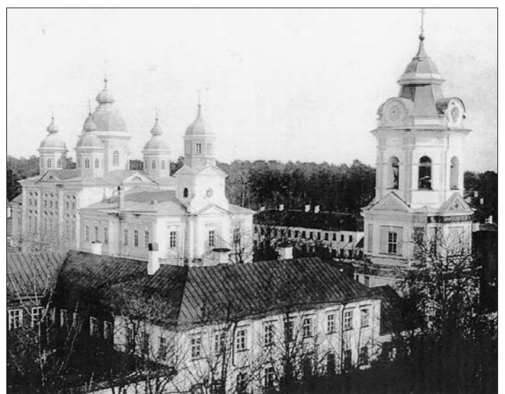
Konevitsan luostari ennen sotia.