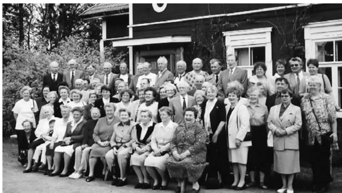
Koulupiirikokouksen osanottajat Kinnalan Koukulla 2002. Usea kuvassa näkyvä henkilö on jo ehtinyt matkasuavansa laskea. Silloin kultaan Taubilan vaiheista (Lehtonen), nyt koulupiirikokouksensa päätetään jo Taubilan kartan ja yli 200 muun kohteen vaiheista kertovan kirjan ennakkomyynnistä.