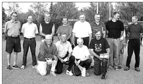
Joukkueet kilpailun jälkeen yhteiskuvassa.

Toisesta tilasta käytiin kova kilpailu Huittisten ja Vammalan joukkueiden kesken. Puoliaika päättyi Huittisten osalta -17 pisteeseen Vammalan saadessa -18 eli yhtä pappia vähemmän. Ilmassa oli suuren urheilujuhlan tuntua kun ratkaiseva toinen erä alkoi. Molemmat joukkueet tunaroivat useita heittoja ja kun jäljelle jääneet kyykät laskettiin todettiin