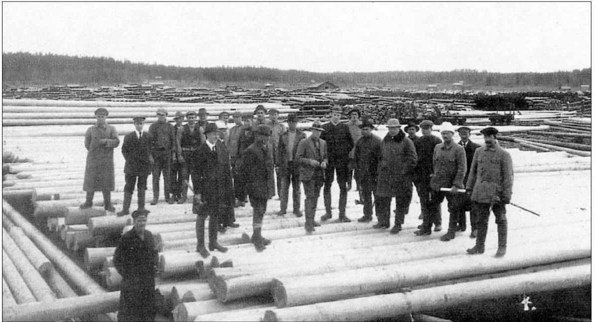
Menossa on pylväiden luovutusmittaus ja paikalla ovat ostajien ja myyjien edustajat sekä metsureita.

Pyhäjärven seurakunnalla oli arvokkaat pappilain virkataloihin kuuluvat metsät. Suurin osa niistä sijaitsi Käksälmen rajalla Pyhäkylästä Käksälmeen vievän maantien oikealla puolella. Sotien ennen seurakunnan metsäpinta-alat lisääntyivät ostojen kautta. Seurakunnan metsiä hoidettiin hyvin. Niinpä esim. ulkopalstalla kaijettiin oja 37 kilometriä vv. 1935-1937. Kuusen ja lehtikuusen taimia istutettiin 43 000 kpl. Vaikka metsänhoitotoihin kului paljon seurakunnan rahaa, esim. v. 1937 puhdasta tuottoa tuli 1 131 215 silloista markkaa. Seurakunnan metsäpinta-ala oli ennen sotia 1 039 ha.