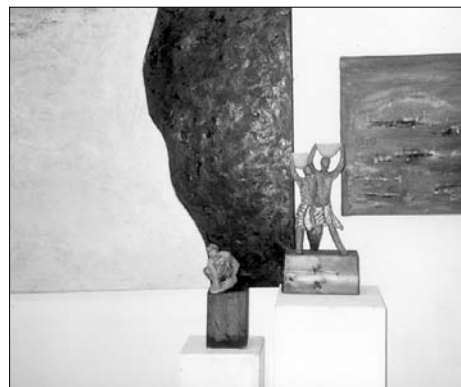
Ikaalisten kuvataideyhdistyksen juhlanäyttelyssä.