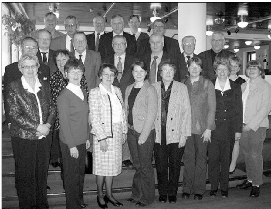
Hallintoneuvoston kokouksen Vammalan seurahuoneelle 18.3. osallistui hallintoneuvoston ja hallituksen jäseniä ja varajäseniä.

Kokous hyväksyi Vpl. Pyhäjärvi-lehden ja Vpl. Pyhäjärvi-Säätiön talousarvion vuodelle 2006. Lehden tilaushinta pidetään entisenä eli 20 euroa/vuosikerta. Hallituksen ja hallintoneuvoston jäsenille ei makseta kokouspalkkiota, mutta matkakus-