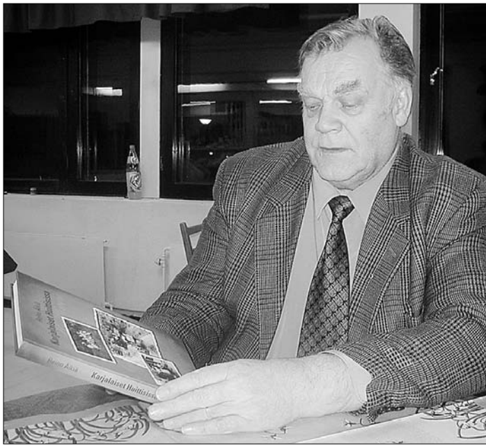
Reino Äikiän kirjassa on kansista alkaen puhuttelevia kuvia.

- Ensimmäiset muistikuvat alkavat jatkosodan ajalta Pyhäjärveltä, kun naiset las-