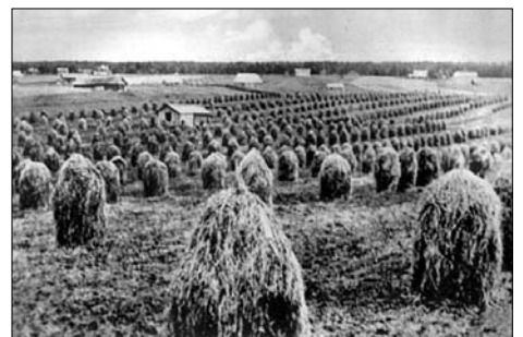
Puikkoisten kylän keskustan viljelyksiä.

Etusivun ylälaudassa on linkki Talokartta- ja Asukastiedot sivuille. Asukastiedot - sivulla on myös palautuslomake, jonka avulla voi korjata ja täydentää asukastietoja kirjoittamalla talon n:o ja täydennystiedot lomakkeelle ja sen jälkeen painamalla Lähetä näppäintä. Tiedot välittyvät sivujen ylläpitäjälle ja päivittyvät Asukastiedot sivulle muutaman päivän viiveellä.