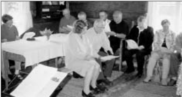
Kuvassa yhteislauuilan osanottajia.