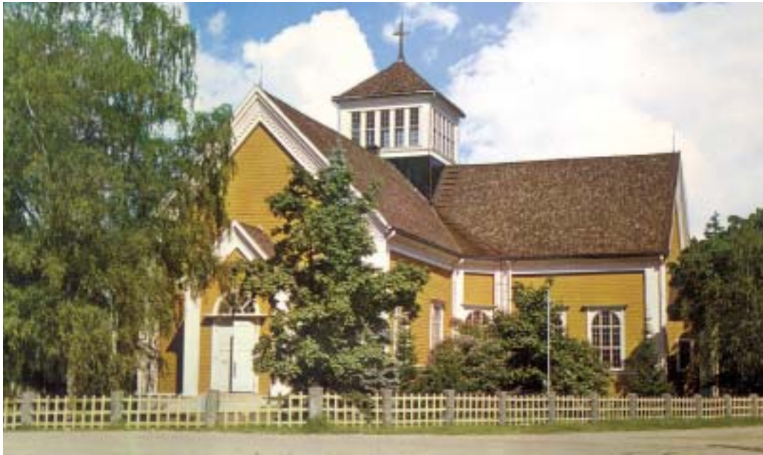
Ikaalisten kirkossa on Muistojen Ilta ja Juhlamessu.