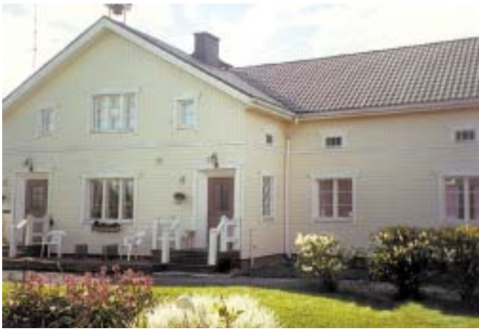
Korttesluoman talo Jämijärven Suurimaalla.

Sodan kokeneilla nuorilla oli voimakas tarve rakentaa toisenlaista maailmaa, hive-