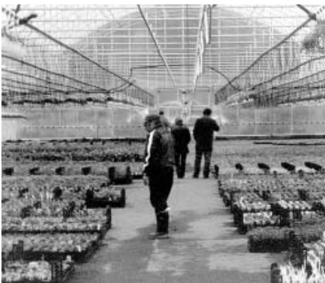
Satakunnan Taimitukulla on 7000 m 2 pinta-alaa.

Juha toteaa, ettei tämänlaatuiseksi yritykseksi ole paikalla sanottavampaa merkitystä. Tuotteet kulkeutuvat