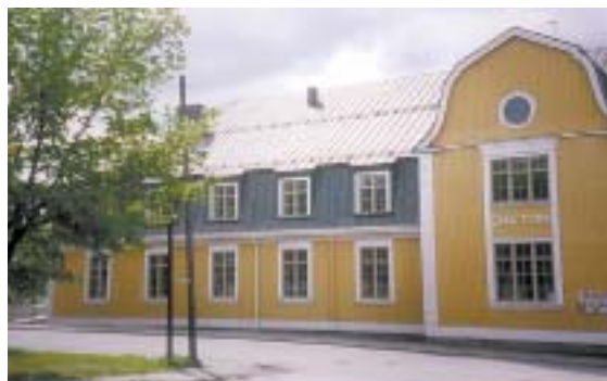
Omalla Tuvalla ovat Pyhäjärvi-juhlien illamat ja sunnuntain päiväjuhla.