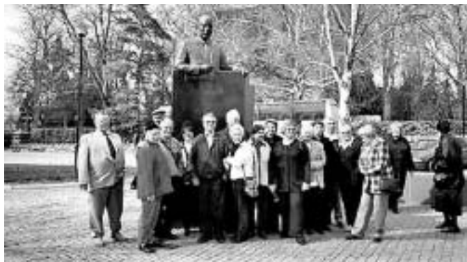
VPL Pyhäjärvi-seuran retkeläiset kävivät myös Johannes Virolaisen muistopatsasta katsomassa Lohjan kirkolla.

Tehokkaasti ja vauhdilla opastetun kierroksen aikana saimme tutustua edesmenneen valtioneuvoksen merkittävään elämäntyön varrelta kertyneisiin muistoesineisiin ja mm. kokoelmiin