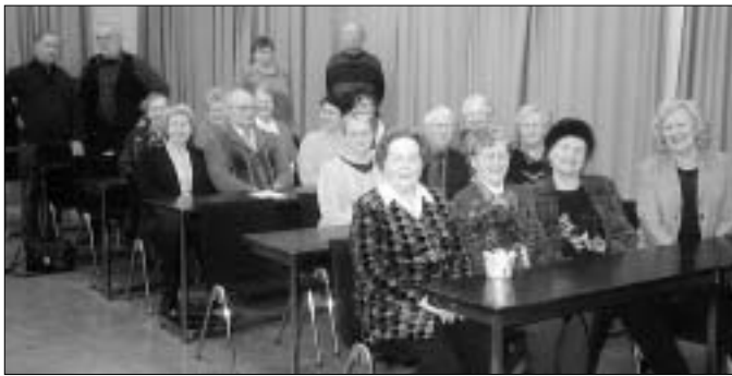
Tampereen kerholaisia vuosikokouksessa.

Kerho kokoontui joka kuukauden toinen sunnuntai klo 13 Vanhalla Kirjastotalolla. Johtokunta kokoontuu tuntu ennen. Poikkeuksena tekee tänä vuonna toukokuu, jolloin teemme kevätretken Kangasalle Äijälään ym. ja se