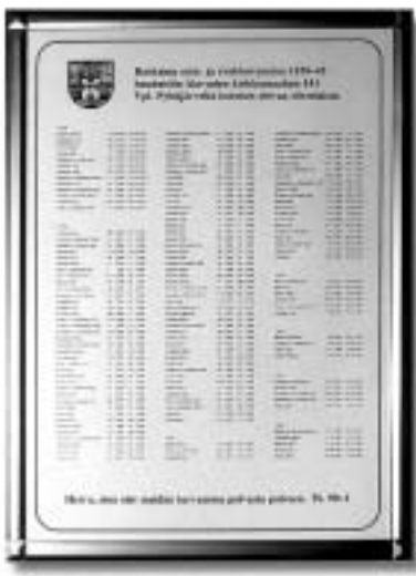
Pyhäjärveläisistä vainajista koottu nimitalu on Alavuden kirkossa.

Tässä mielessä järjestettiin siirtoväelle kokouksia. Pyhäjärveläisten kihupyhänä, joka on 8:s sunnuntai Kolminaisuuden päivästä, pidettiin kesällä 1940 pyhäjärveläiset kirkonmenot. Siirtoväkeä oli silloin Alavuden avara kirkko ääriään myöten täynnä. Omat papit silloin toimittivat kirkonmenoja, oma kanttori silloin oli johtamassa seurakunnan veisuuta. Samanlainen tilaisuus oli Alavuden kirkossa viime huhtikuun 20 p. Se jatkui juhlanä Kyrönselän Nuorisoseuran talolla. Siellä toimittivat sekä alavudeltaiset että pyhäjärveläiset ohjelmassa. Paljon oli myös koolia pyhäjärveläisiä, kun viime huhtikuun 3 p. pidettiin Kuortaneella kyläluvut. Rattoisesti kului aurinkoinen