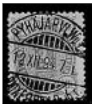
Vuonna 1894 Vpl. Pyhäjärven postileimassa postin nimi oli Pyhäjärvi Vpl.

Etelä-Karjalaan), Lasse Könönen (Luovutetun Karjalan postileimoja), Risto Pitkänen (Luovutetun Karjalan venäläisleimat), Hannu Elo (Suomenlahden luovutettujen saarien postileimoja), Kari Pohjakallio (Viipurinlinnin Pyhäjärvi), Matti Parkkinen (Käkisalmi), Teuvo Termomen (Kivennapa), Harri Jäppinen (Viipuri), Anssi Mikko (Viipurin postileimoja itsenäisyyden ajalta), Lasse Könönen (Luovutetun Karjalan dokumentti), Aarre Ritola