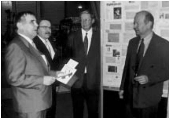
Vpl. Pyhäjärvi-kokoelman sivuja postimerkkimessujen näyttelyssä.