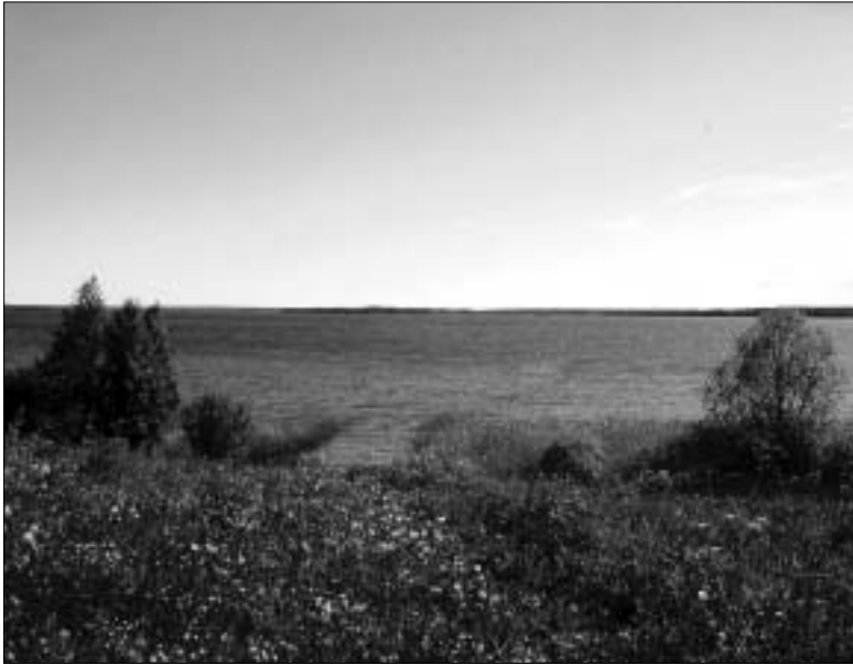
Pyhäjärvi papan kotirannasta katsottuna, taustalla Isvankansaari.

"Meissä herätti ihmetystä Räisälässä "nuorisotoloksi" muutetussa kirkossa pidetty disco. Uteliasuuttamme olimme menneet ihmettelemään menoa, keskellä kirkosta perjantaipäivää, mutta pappi ja muut eivät ehtineet