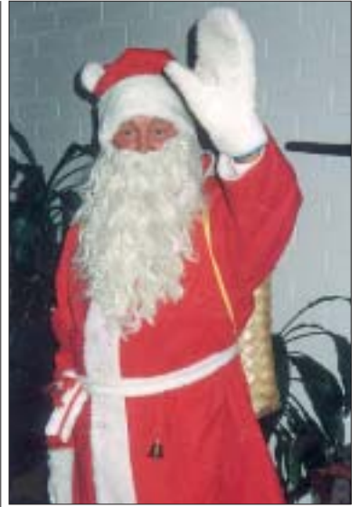
Joulupukki Tampereelta toivottaa hyvää joulua.