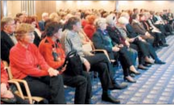
Karjalaisuus tutuksi -tapahtuma veti laivan Conferencekeskuksen tupan täyteen kuulijoita.