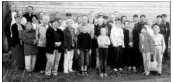
Matkaseurue koulun paljastetun laatan äärellä.