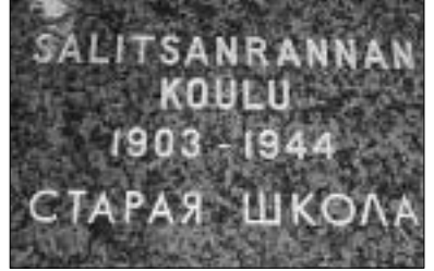
Koulun päätyseinään kiinnitetty muistolaatta.

Samana päivänä tutustuimme myös Taubilin kartanon seutuun. Ennen niin mukkeasta navetasta oli jäljellä enää kivinen runko. Yläosan puurakenteet oli puret-