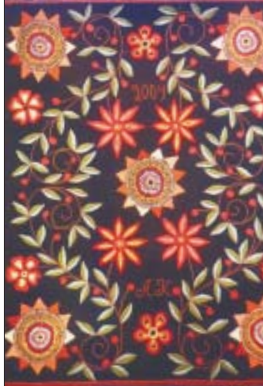
Lahjoitusryijyn taidokasta käsityön jälkeä.