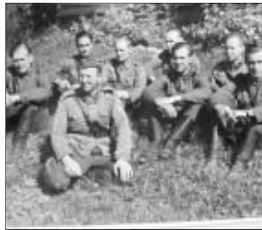
RT-3 sodanaikaista upseeristoa.