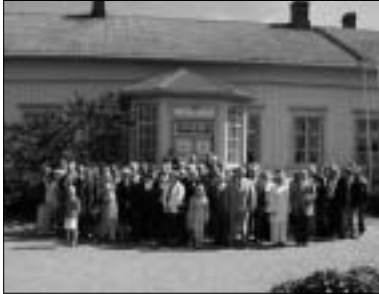
Pakaristen suku yhteiskuvassa Vehmaan tilalla.

Vehmaan tilalla nautittiin sukuteriaa jonka jälkeen ko-