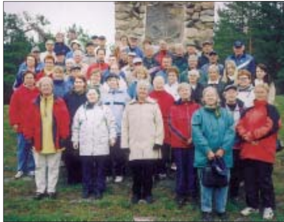
Jakokunnan väki lahjoitusmaatalonpoikien muistomerkillä.