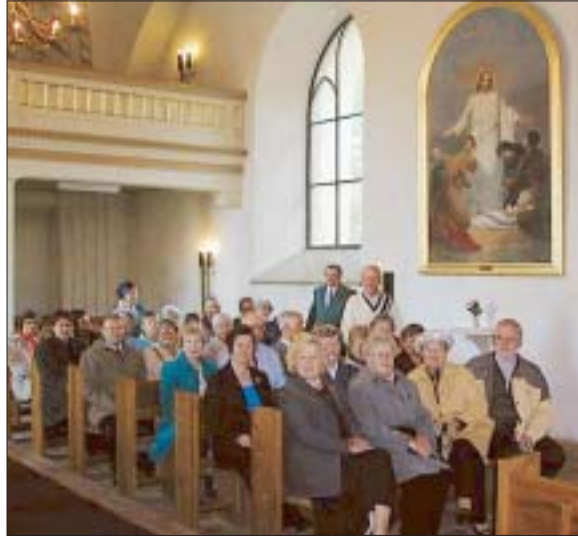
Tampereen Pyhäjärvi-kerholaiset Huittisten kirkossa.

Seuraavaksi meitä otettiin jo Kinnalan Koukussa.