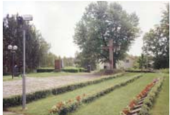
Sankarihaudat sankariristeineen ja Karjalaan jääneiden vainajien muistomerkki Kiikan hautausmaalla.