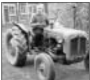
Joonas maatilalla maastossa.

Turusta kiirehditään aina kun on mahdollista Kokemäen Kauvatsalle, jossa isovanhempien maatilaa tanus-keskus on yhteisenä kokoon-