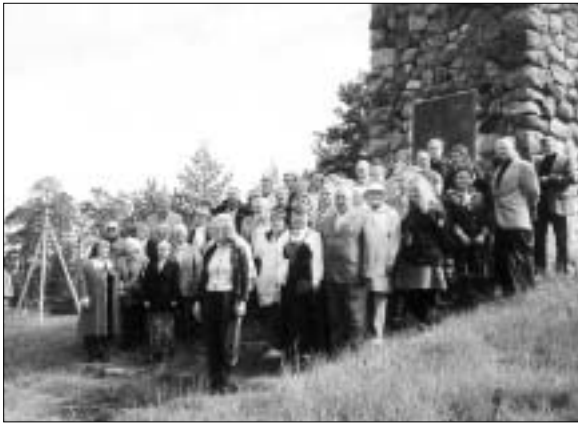
Kukkojen sukuseuran osanottajat kotimaisemissa Pyhäjärvellä.