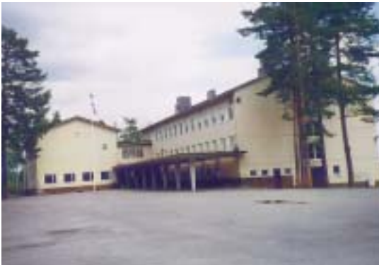
Kiikan koulu on juhlien pääpaikka.