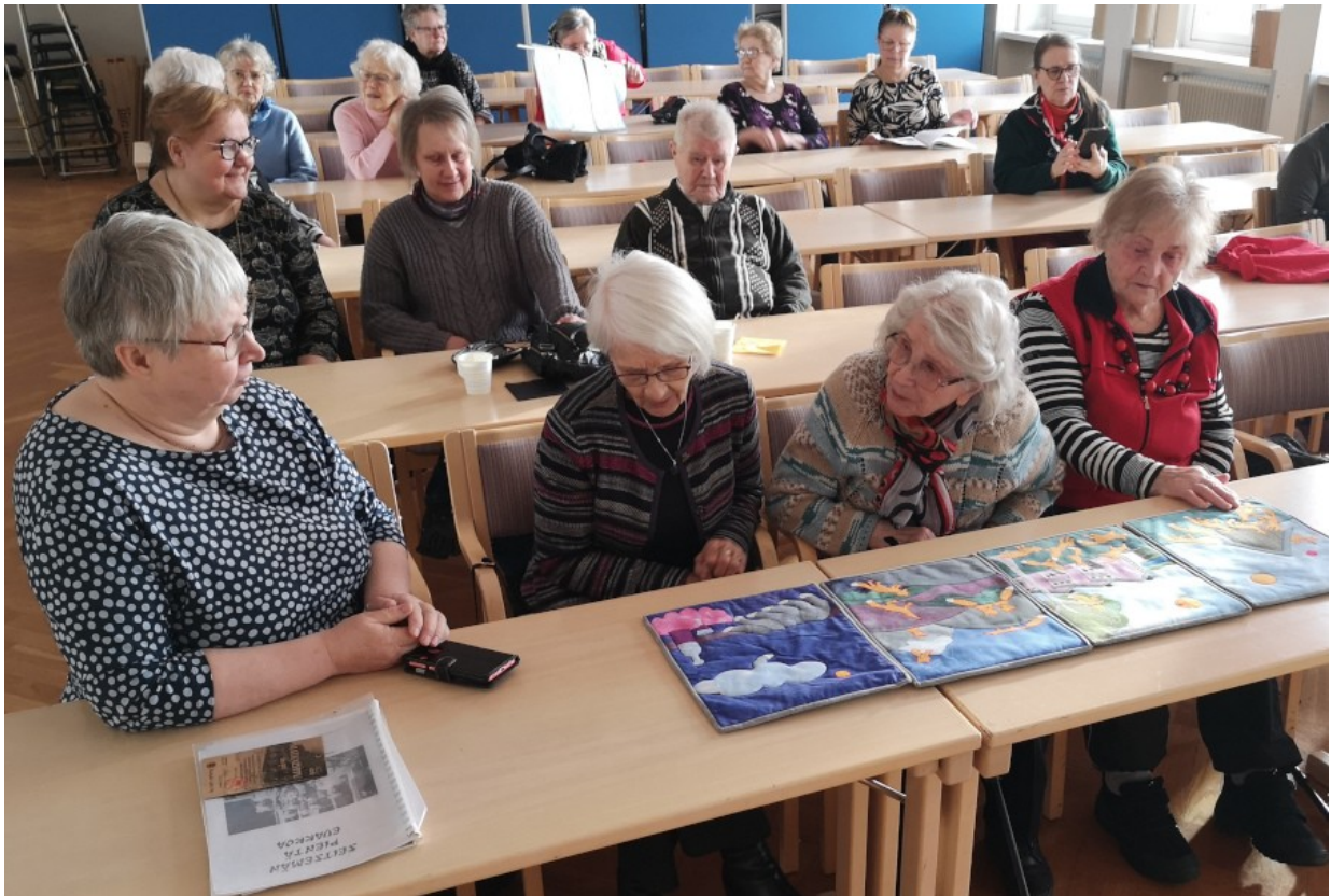
Tilkkutyöt, jotka on tehty värjätyistä lakanakankaista ompelemalla kiertävät yleisön katseltavana. Taidokasta työnjälkeä kiitellään ja ihastellaan: "Pientä, pientä tikkiä, taitavasti tehty!"