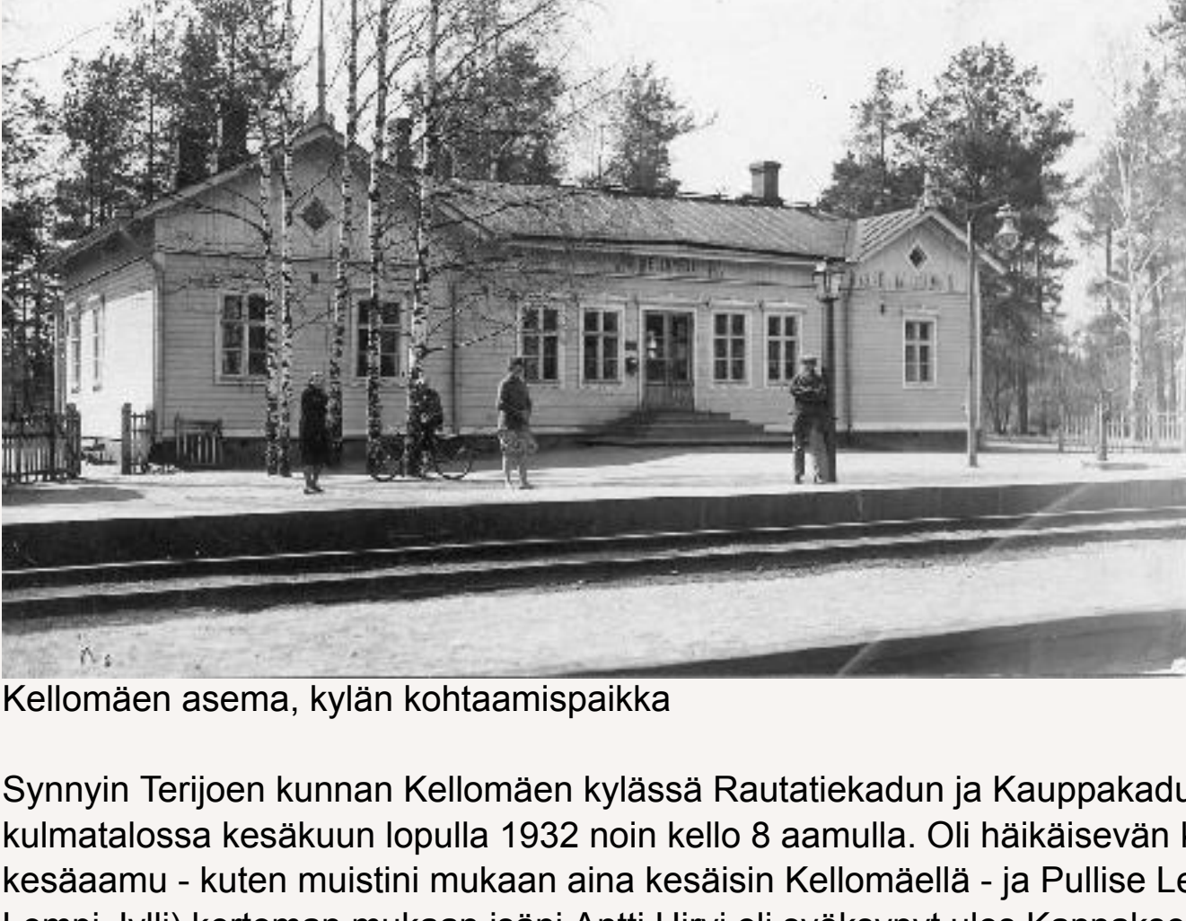
Kellomäen asema, kylän kohtaamispaikka