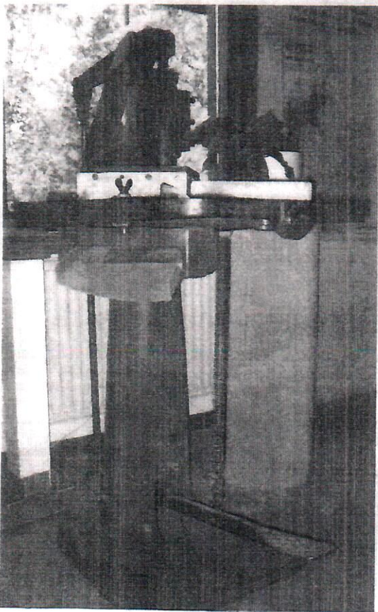
Raivolasta lähti mukaan muutakin kuin nimi. Vanha leikkuri on vanhaa perua ja viettää pääsääntöisesti eläkepäiviään muistuttamassa menneestä.

neuvottelemaan yhteistyöstä. Neuvottelujen tuloksena syntyi Raivolan kotelotehdas Oy, joka aloitti toimintansa 1922.