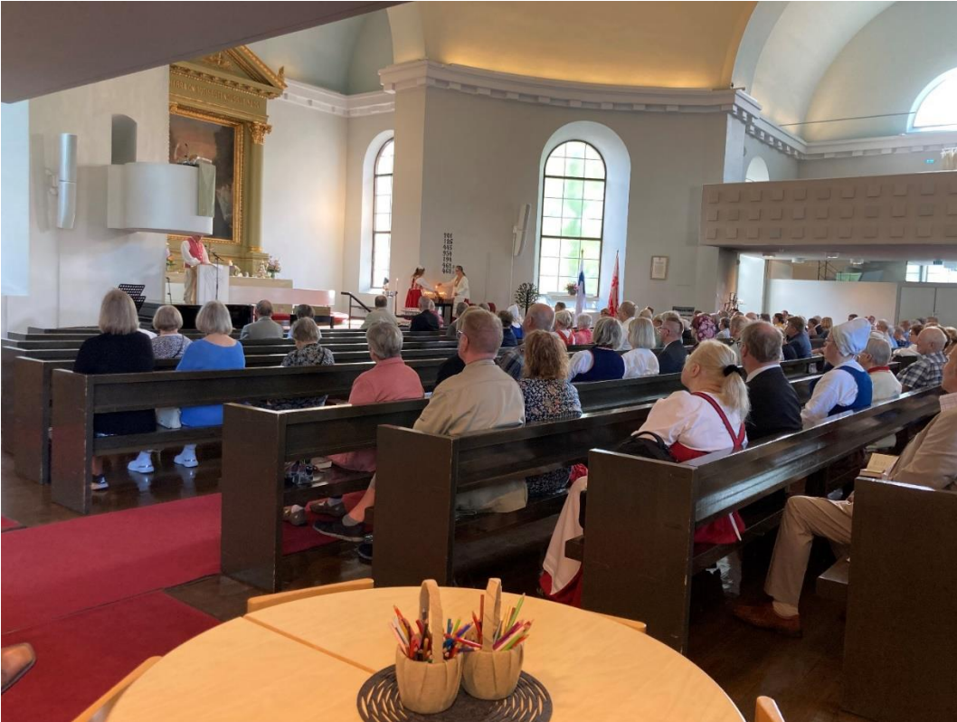
Poisnukkuneiden nimien lukeminen ja muistokynttilöiden sytyttäminen.