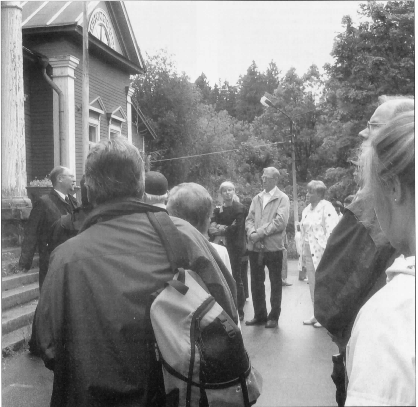
Mikkoa kuunnellaan Kiiskilän kartanon edustalla