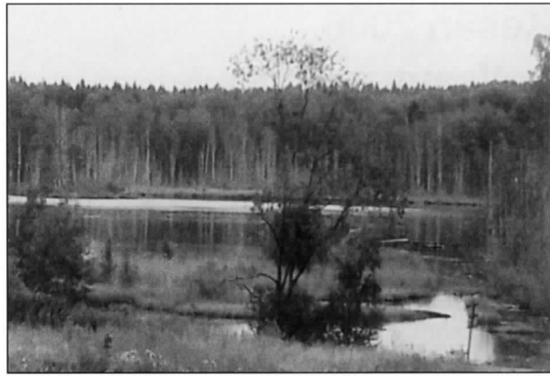
Ihantalan järvi, jonka takaa vihollinen pyrki etenemään.