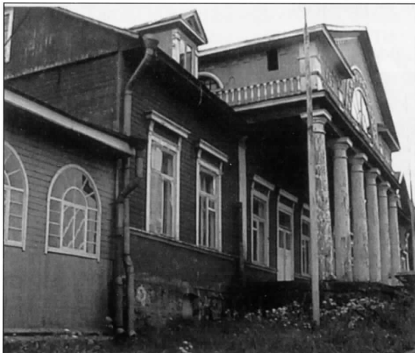
Kiiskilän kartanon päärakennus rappeutuu hoidon puutteessa.