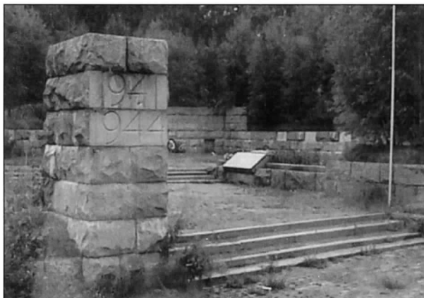
Talin taistelujen muistomerkki