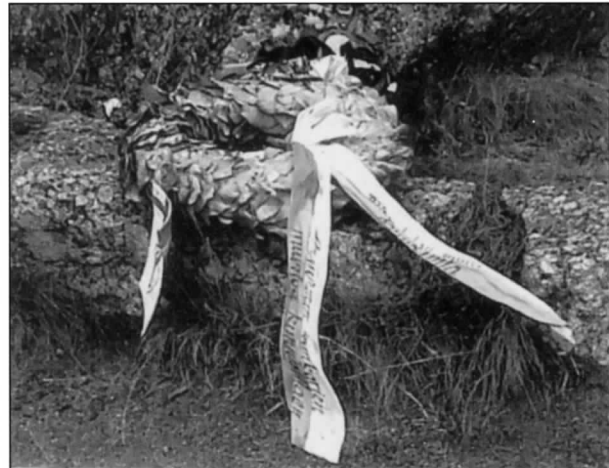
Ennen vierailuamme, olivat aseveliveteraanit laskeneet seppeleen toveriensa muistoksi