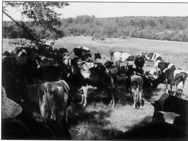
Tervajoen kolhoosin lehmiä laitumella 1.7.2006, kuvattu bussin ikkunasta Vanhakylä-matkalla.

Vahvialassa on nykyisin venäläisen uudehkon kartan mukaan kyläasutusta vain Tervajoella ja entisen kirkonkylän alueella sekä ratavarressa. Muualla on joitain yksittäistaloja. Tyhjiä tai lähes tyhjiä alueita