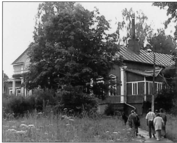
Käveltiin Kiiskilän kartanorakennukselle

Ihantalan jälkeen oli aika kääntyä takaisin Viipurin kautta Vahvialan suuntaan ja käydä sukumme syntysijoilla Koskelassa. Ohjelmaltaan ja asiiasälöltään hyvä matka!