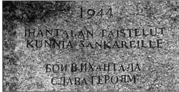
Siirtolohkareeseen kaiverrettu muistokirjoitus