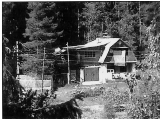
”Datsa” Vanhakylän Revonhännässä, rakennettu entisen Emil Hallikaisen talon paikalle. Kuvattu Salmenkalliolta 1.7.2006.

Kolhoosilaisten muuttoa tuettiin moni tavoin. Heille maksettiin matkat ja omaisuuden kuljetus, myytiin ylimääräisiä huopatossuja, nahkajalkineita, huiveja ja pähineitä. Kullekin perheelle käskettiin