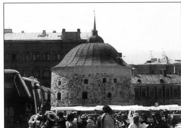
Viipuri. Koskelaiset kotiseutumatka 22.5.2004