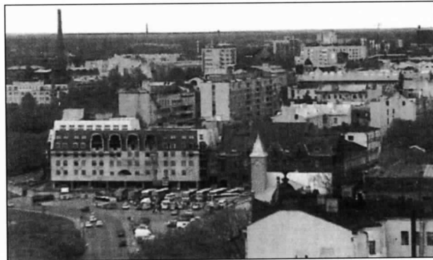
Kotiseutumatka 22.5.2004. Viipurin kauppa- ja bussiparkkipaikka. Kuvattu Viipurin linnantornista.