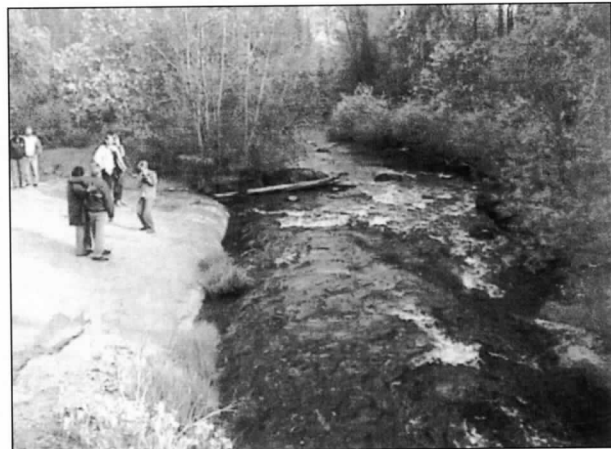
22.5.2004. Koskelan koski