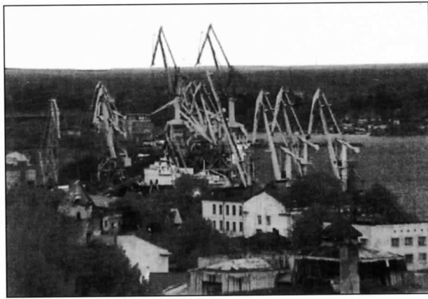
Kotiseutumatka 22.5.2004. Viipurin satamaa. Kuvattu Viipurin linnantornista.