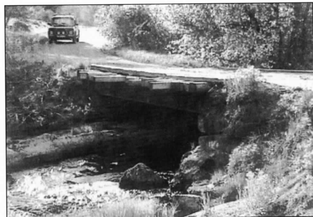
22.5.2004. Silta Koskelan kosken yli