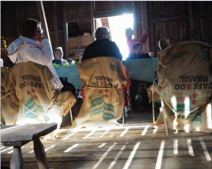
Sisutuskuva juhlasta.