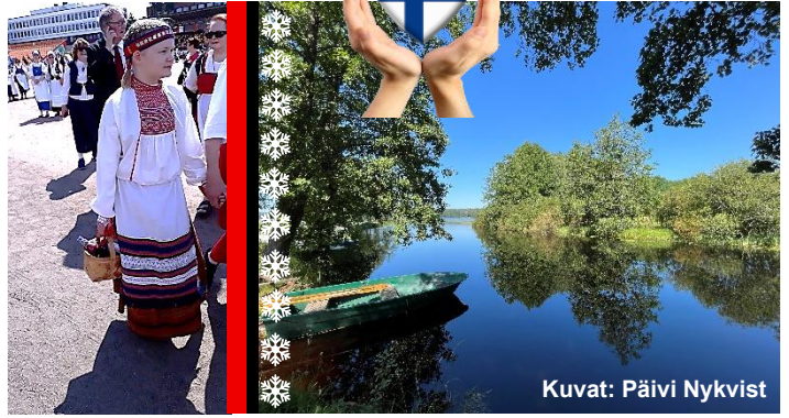
Tyttö kesäjuhlissa Kouvolassa.