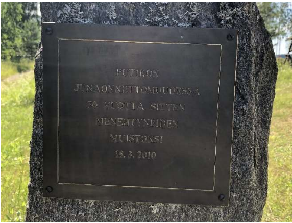
18.3.1940 tapahtuneen junaonnettomuuden muistomerkki Putikon asemalla.

Niin me, kuten evakotkin aikanaan, jatkoimme eteenpäin Punkaharjun nykyisen museotien läpi Savonlinnaan, jossa yövyimme.