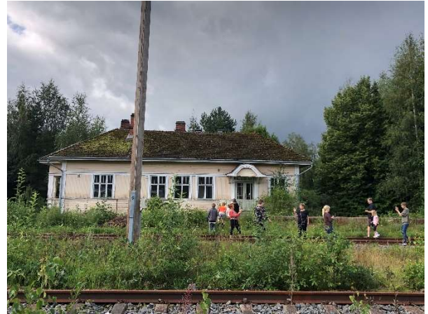
Kallislahden asema seisoo edelleen radan varressa Savonlinnassa.