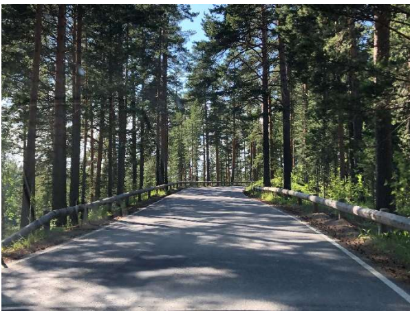
Punkaharjun nykyinen museotie oli sota-aikana ainoa tie Punkaharjun kautta Savonlinnaan kulkeneille.

Niin me, kuten evakotkin aikanaan, jatkoimme eteenpäin Punkaharjun nykyisen museotien läpi Savonlinnaan, jossa yövyimme.