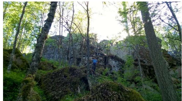
Kuva 12 Antrean Sokanlinna