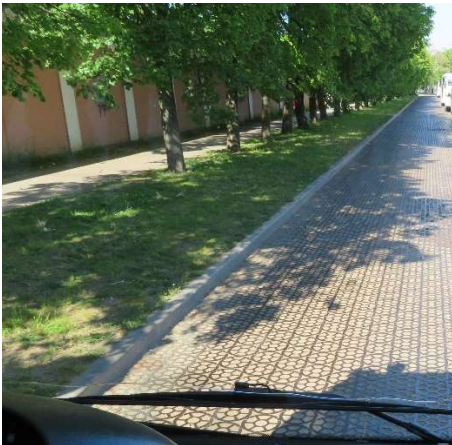
Kuva 1 Valurautatie Kronstadissa