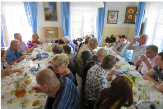
Kuva 8 Lounas maistui luostarin Trapezassa