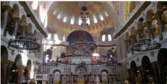
Kuva 2 Pyhän Nikolain laivastokatedraali Kronstadissa

Yövyimme Losevossa, Kiviniemen kosken rannalla.