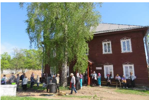
Kuva 9 Luostarin Trapeza

Kolmantena matkapäivänä suuntasimme Räisälän kautta Vuoksenrannan kirkolle ja sieltä Kaskiselkään, jossa jokaisella oli mahdollisuus viettää hetki aikaa omilla kivijaloilla. Paluumatkalla poikkesimme Antrean Sokanlinnassa katsomassa kuuluisaa juhlakalliota ja luolastoa, joka teki suuren vaikutuksen ensikertalaisiin kävijöihin. Illansuussa palasimme koti-Suomeen jälleen uusia tuttavuuksia ja kokemuksia repussamme. Mukana matkalla oli 25 suvun jäsentä.