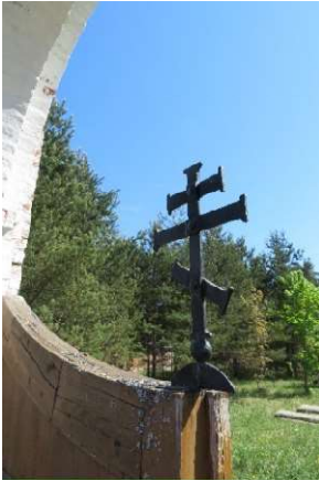
Kuva 6 Luostarin hautausmaan portti