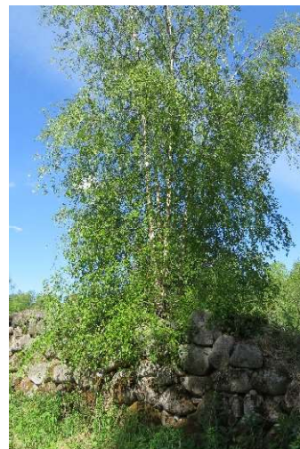
Kuvat 10 ja 11 Omilla kivijaloilla