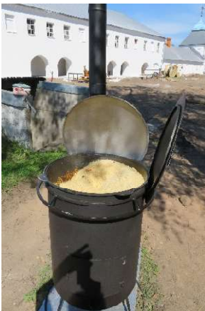
Kuva 7 Lounasriisimme kypsyy padassa