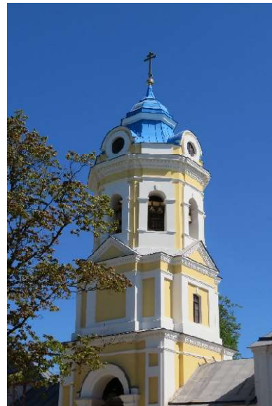
Kuva 3 Konevitsan luostarin kirkko

Ennen mantereelle lähtöä söimme vielä makoisan lounaan luostarin trapesassa.