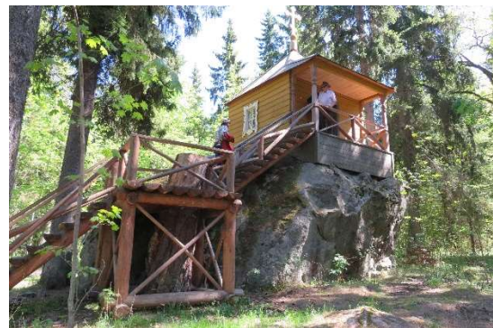
Kuva 4 Hevoskiven tsasouna