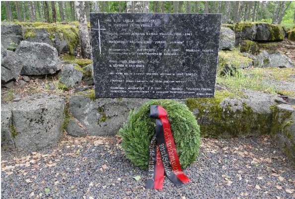
Kuva 1 Antrean kirkonmäellä

Päivän aikana myös monet matkalaiset vierailivat sukunsa vanhoilla kotipihoilla.