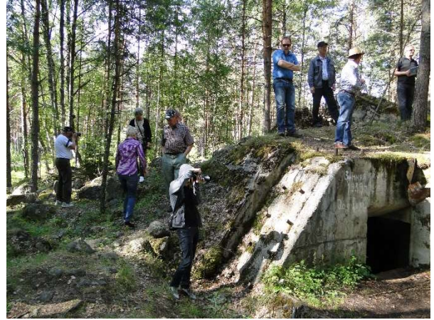
Kuva 9 Inkilän bunkkerilla

yhteisvoimin työntämällä auton irti ja pääsimme jatkamaan matkaa.