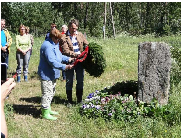
Kuva 2 Vuoksenrannan kirkolla