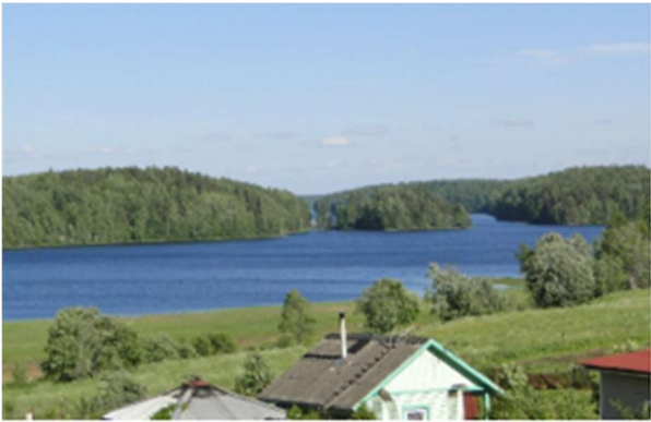
Kuva 7 Helisevänjärven rannalla

Kolmantena matkapäivänä tutustuimme Länsi-Kannakseen poiketen matkan varrella mm. Koiviston kirkolla, Kuolemanjärvellä, Inkilässä, Vammelsuussa ja Terijoella.