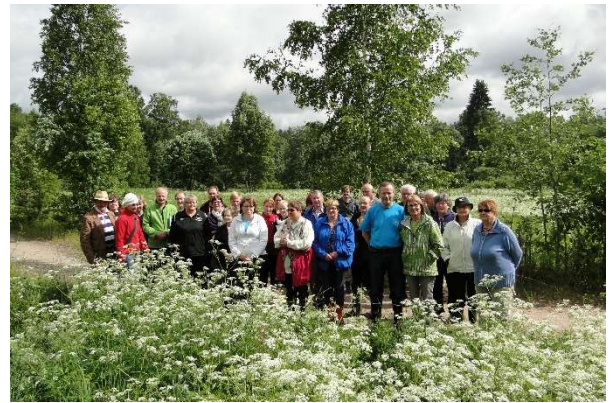
Kuva 4 Yhteiskuvassa Peltolanmäellä