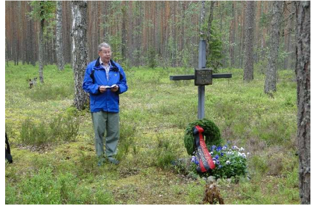
Kuva 3 Metodistiseurakunnan hautausmaalla Leiposissa