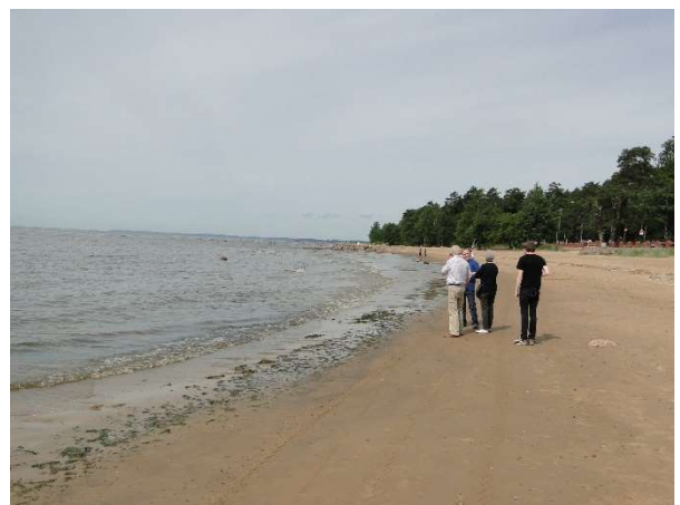
Kuva 11 Terijoen hiekoilla

Mukana matkalla oli yli 30 sukuun kuuluvaa.