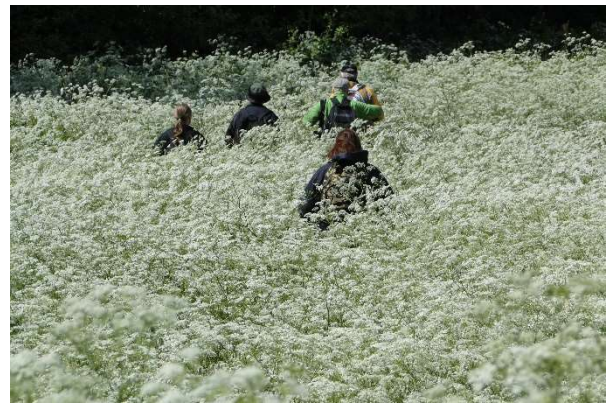
Kuva 5 Matkalla Niemelän "mummolaan"

Päivän lopuksi suuntasimme Kirvun Jantulan kylään Helisevänjärven rantaan, josta suvun kantaisä Elias Yrjönpöika lähti perhekuntineen kohti Kaskiselkää 1690-luvun lopulla.