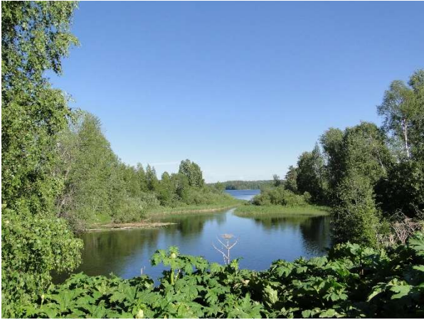
Kuva 6 Helisevänjärven ja Kuunjärven välisellä sillalla