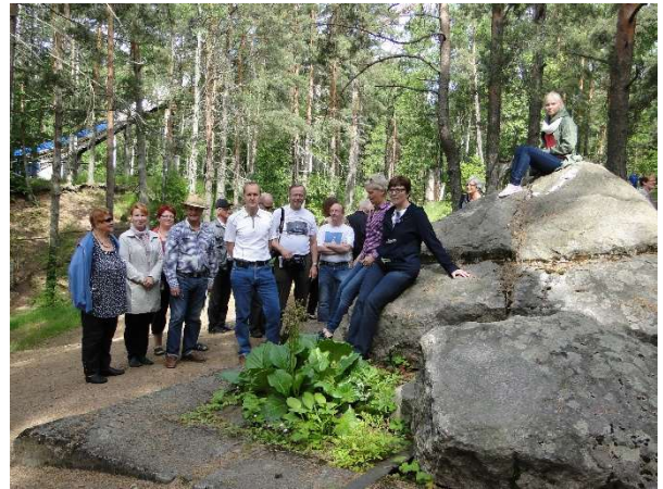
Kuva 10 Rakkauden haudalla Vammelsuussa