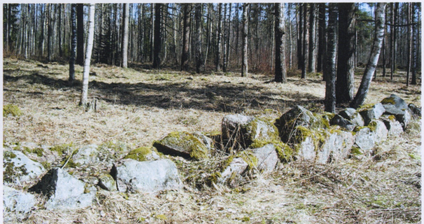
Hautausmaan kiviaitaa, jonka takana näkyy siistittyä hautausmaata.

hieman tutkia ympäristöä. Lähdemme ajamaan Salon suuntaan nähdäksemme Kaltoveden ja Uitukan salmen, mutta kevään huonokuntoinen tie estää sen. Palaamme takaisin kirkolle ja jat-