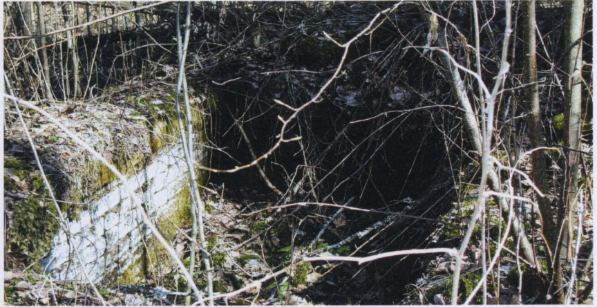
Ruumishuoneen säilynyt kellariosa.