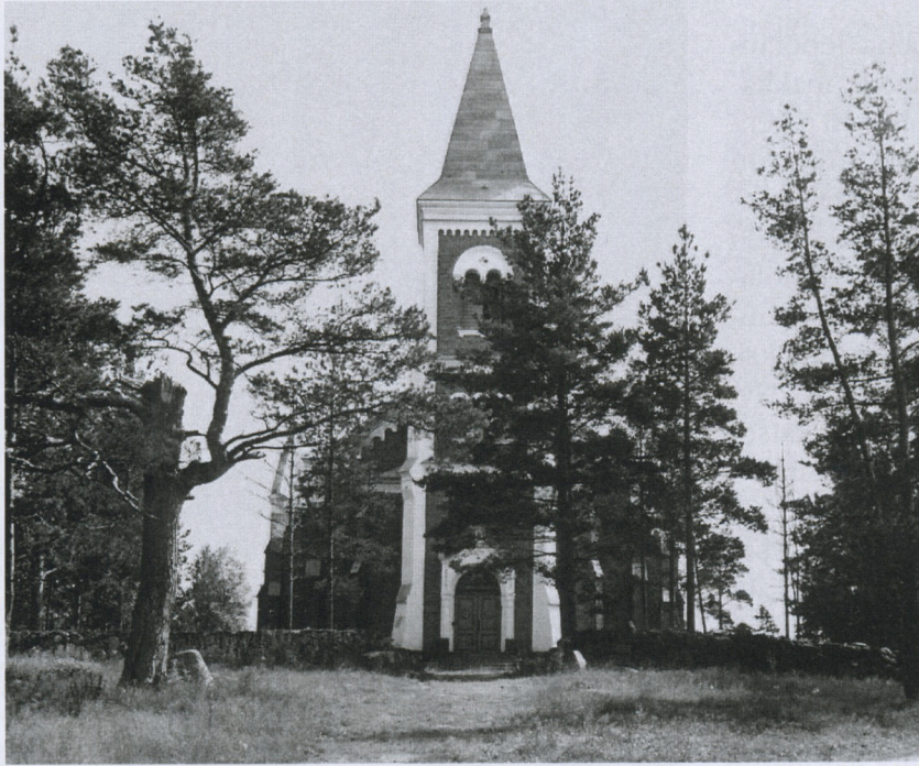
Ristitön kirkko 18.7.1943

osa puitteistakin oli säpäleinä ja siellä täällä jyrkevissä tiiliseinäissä oli luotien tai sirpaleiden lohka-