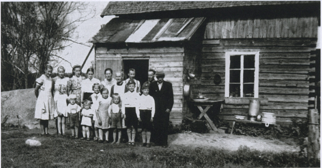
Sodalta säästynyt Parikan sauna, joka antoi yösijan vakituisesti 13 asujalle ja tilapäisesti vielä neljälle vieraalle kesällä 1942.

keytyi, kun seurakunnilta kiellettiin työvoima. Työ pääsi jatkumaan seuraavana kesänä ja se