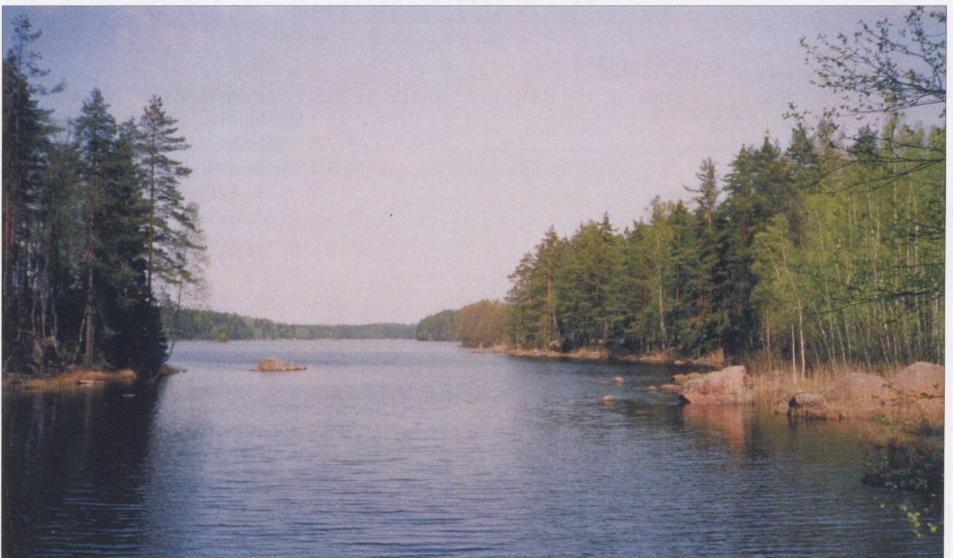
Tuokkolanjärvi Salmensillalta nähtynä.

Jos haluat, että omaisesi poismenosta ilmoitetaan seuraavan Heinjoki-juhlan Jumalanpalveluksessa, olisi varmintä, että ilmoittaisit siitä itse Heinjoki-Säätiölle puh. 09-2245 809.