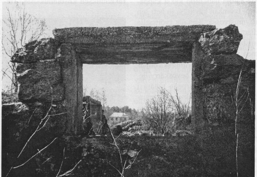
Kunnalliskodin navetan raunion läpi näkyy kanttorila nykytilassaan.

Ennenvanhaan talollisille oli määrätty tieosuudet, jotka heidän oli rakennettava ja pidettävä kunnossa, näin Heinjoellakin. Nimismies oli sitten tullut tarkastamaan, kelpaako heinjokelaisisännän tie. Isäntä seisoi nöyränä ja vaiti lakki kädessä nimismiehen moittiessa tietä liian kapeaksi. Nimismiehen lähtiessä isäntä kuitenkin huusi hänen peräänsä: ”Herra Vallesmanni!” Nimismies pysäytti hevosensa ja kääntyi kysymään isännän asiaa. ”Piisaaks pittuus, herra Vallesmanni?”, kysyi isäntä piloillaan. Nimismies heilautti hattuaan ja patisti hevosensa juoksuun.