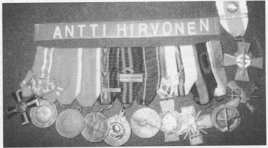
4. luokan Vapaudenristi miekoin vuodelta 1918, 2. luokan Vapaudenmitali vuodelta 1939, 2. luokan Vapaudenmitali vuodelta 1940, Vapaussodan muistomitali Viipurin soljella, Talvisodan muistomitali miekoilla ja Karjalan Kannas-soljella, Jatkosodan muistomitali, Patterimäkeläisten risti (Viipurin taisteluista 1918), Heimosotaristi (vuosilta 1918-1922), Karjalan muistomitali (Aunuksen puolesta 1919), Itä-Kannaksen risti (15. Divisioona ja 19. Prikaati), Sininen Risti miekalla, 1917-1918-soljella, Sotavammamerkki.