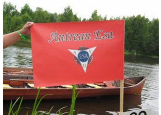
Seuran urheilutoimintaa toteutetaan perinteikkään Antrean Esan kautta.