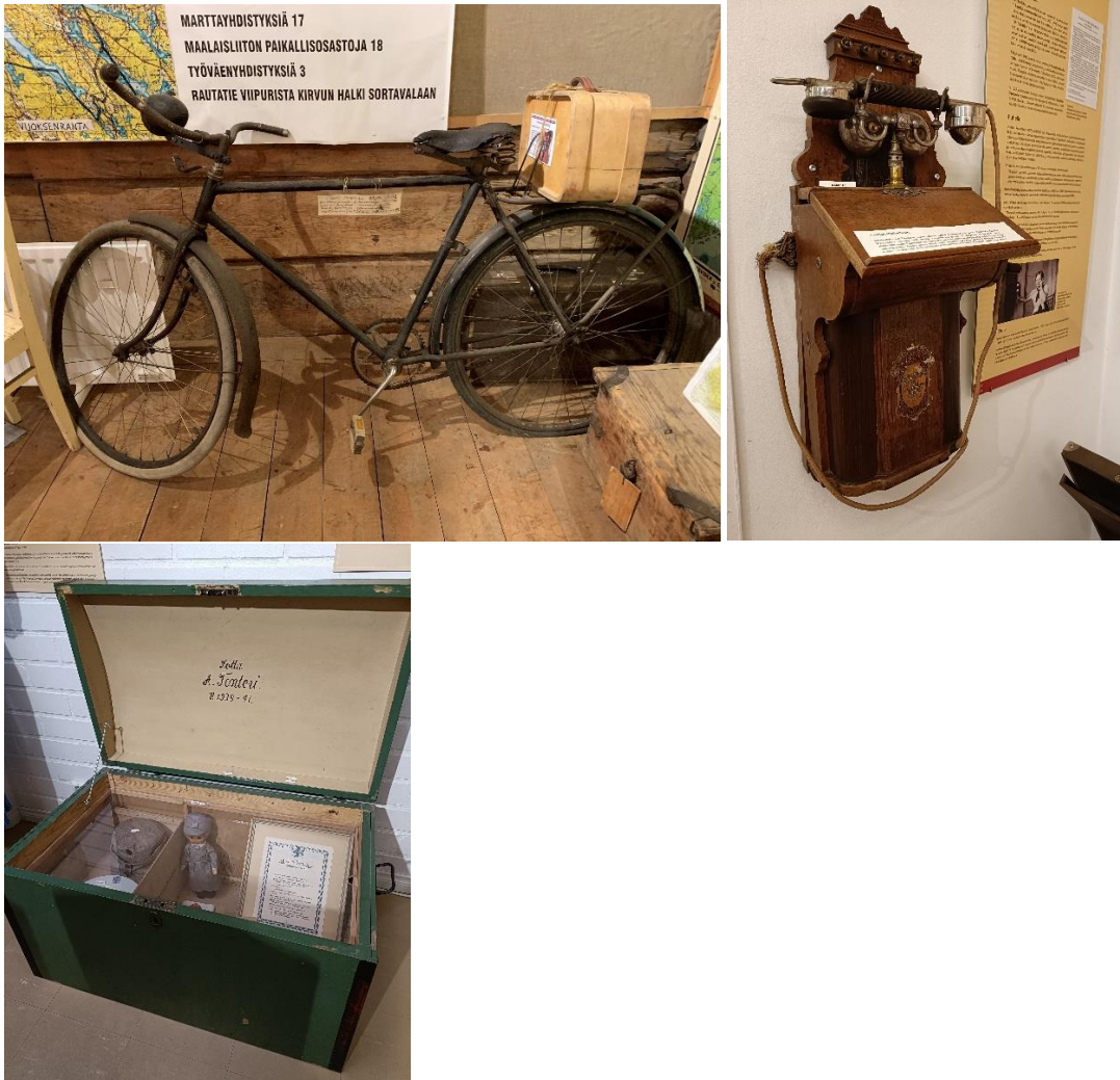
Kirvu museon ja Räisälä museon esineistöä.

kokoelmiaan. Ne seurat, joilla digitointiprojektit olivat jo meneillään, kertoivat omista kokemuksistaan. Usealla museolla oli jo kokoelmapolitiikka tai kokoelmasuunnitelma, jonka mukaan toimitaan.