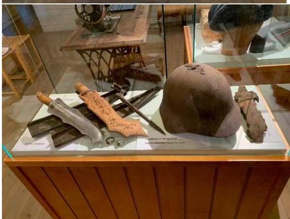
Kangasalan Äijälä-keskuksen museon esineistöä.