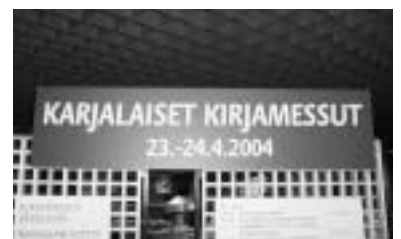
Juhlaportti johdatteli yleisön messutapahtumaan.