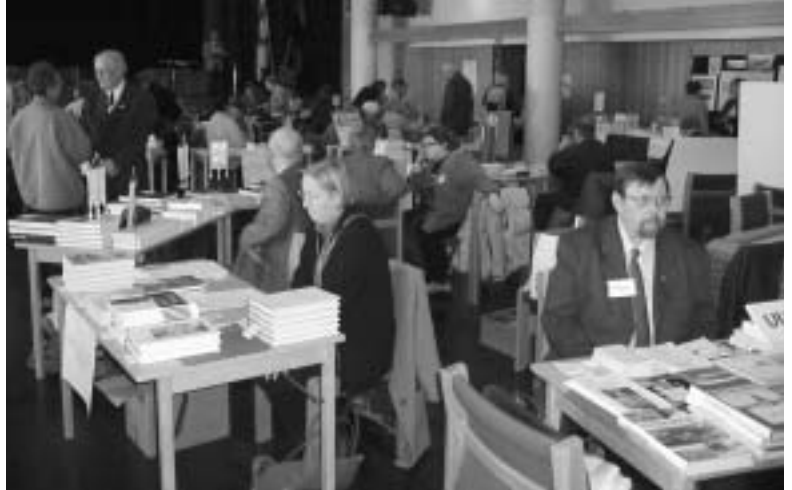
Karjalatalon juhlasali antoi hyvät puitteet messuille.