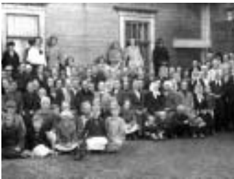
Salitsanrannan äitejä 1930.

Vaikka Äitienpäivän vietto on aloitettu vasta 1900 – luvulla sen esiin tuoma ajatus kohdistuu myös menneiden sukupolvien äideille. Äideille, jotka usein alkeellisissa oloissa synnyttivät suuren määrän lapsia, hoitivat heitä ja pitivät tarmolla huolta kodin kunnosta, siisteydestä, luonnonläheisten olojen terveysvaatimuksista, tautien torjunnasta jne. Tämä tapahtui talon muiden töiden ohessa. Myös lasten kasvatusta luonnon oloissa. Myös lasten kasvatusta luonnon oloissa äideille kun miehet tekivät raskaat ulkotyöt ja lahjoitusmaakaudella kävivät "robotissa". Tästä eivät tietenkään naisetkaan olleet vapautettuja, päinvastoin. Äitien rooli, 1800 – luvun suurperheissä ja myöhemmin, oli myös eettisen-, moraalisen ja isänmaallisuuskasvatuksen kannalta ratkaisevaa meidänkin kotiseudullamme.